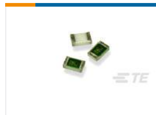
TE 产品编号8-1879215-2 CPF 0402 32K4 0.1% 25PPM 1K RL