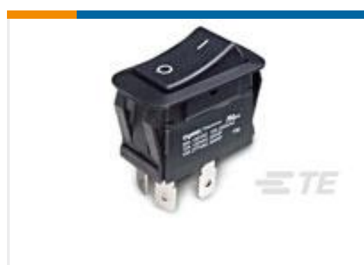
TE 产品编号1571095-2 PRCSA1-20F-BB0BW,POWER ROCKER