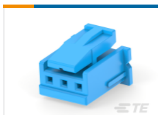
TE 产品编号2-2338183-3 EP 2.5 HOUSING 3P, BLUE, UL version