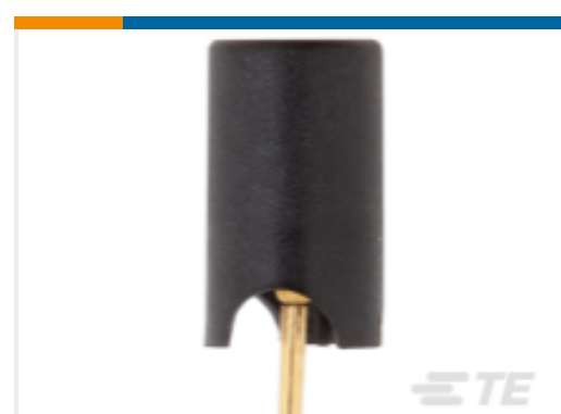
TE 产品编号ANT-916-JJB-HT-T Antenna Mini Straight Hi-Temp 916MHz THM