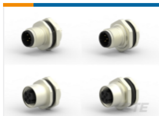
TE 产品编号T4132512041-000 M12 面板安装焊杯