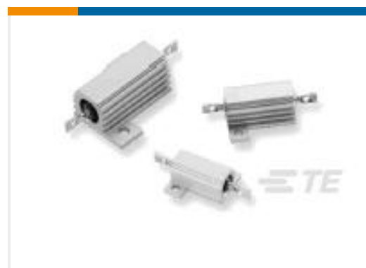
TE 产品编号5-1879075-5 THS25 10K 5%