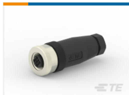
TE 产品编号T4110401031-000 M12,FEMALE,STRAIGHT,B CODE,3P, PG7,GOLD