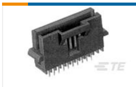
TE 产品编号5-104071-4 20 SYSTEM 50 HDR SRST SHRD SN