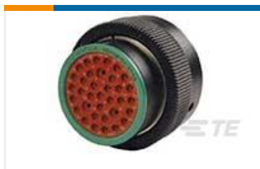
TE 产品编号HDP26-24-35SN PLG, 35P, BLK, N, 16/20, S