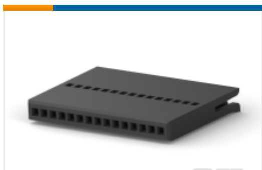
TE 产品编号487545-9 FFC 母端外壳 : 1.27mm