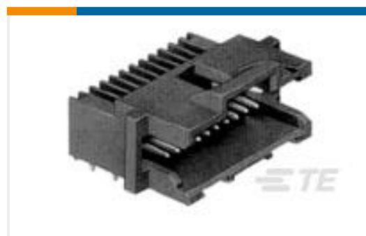
TE 产品编号6-104069-2 24 sys 50 hdr drdra shrd sn