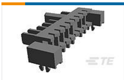
TE 产品编号6318790-1 PLUG ASSY,PB-FREE,2.5 SLIM BATTERY OFF-S