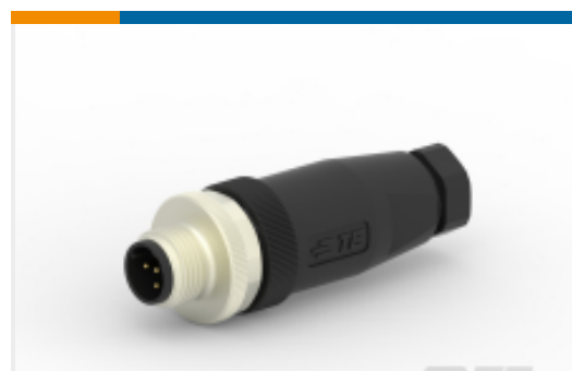
TE 产品编号T4111501051-000 M12,MALE,STRAIGHT,D CODE,5P, PG7,GOLD