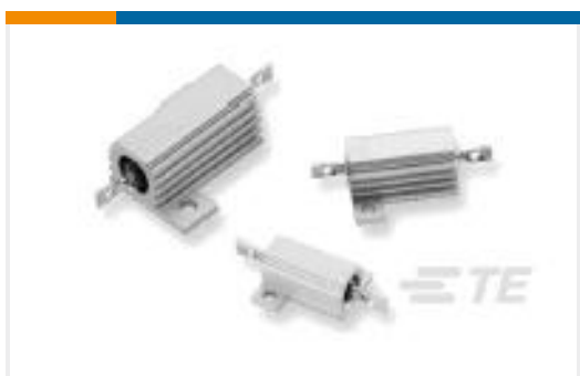
TE 产品编号3-1879074-4 THS15 390R 5%