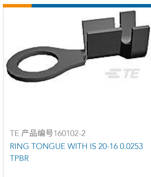
TE 产品编号160102-2 RING TONGUE WITH IS 20-16 0.0253 TPBR