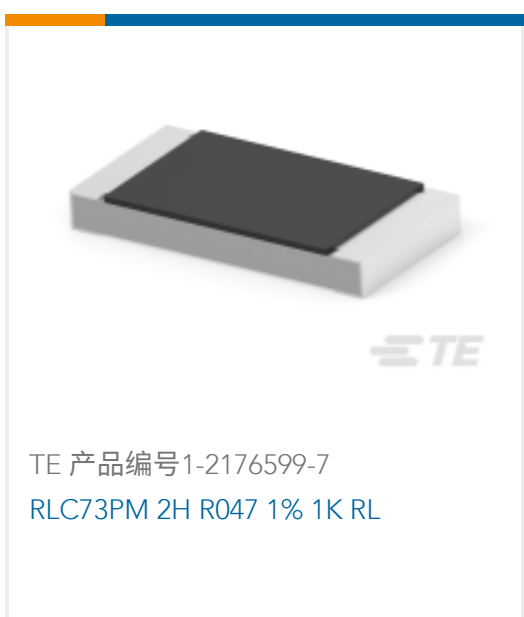
TE 产品编号1-2176599-7 RLC73PM 2H R047 1% 1K RL