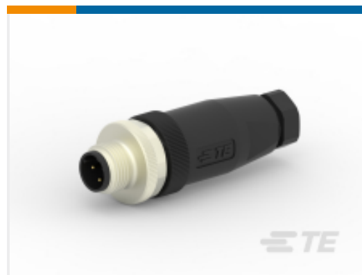
TE 产品编号 T4111501041-000 M12, MALE, STRAIGHT, D CODE, 4P, PG7, GOLD