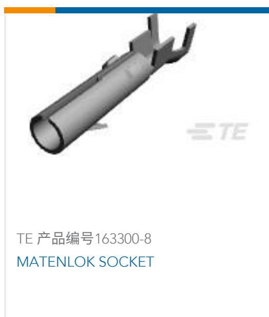
TE 产品编号163300-8 MATENLOK SOCKET