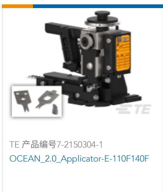
TE 产品编号7-2150304-1 OCEAN_2.0_Applicator-E-110F140F