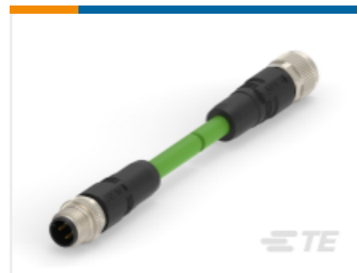
TE 产品编号 CAT-SI113-M1B M12 D-code 4pin Male to Female Cable Assembly, Cat5e Polyurethane 22AWG Shielded