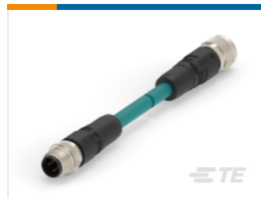
TE 产品编号 CAT-SI113-M1 M12 D-code 4pin Male to Female Cable Assembly, Cat5e TPE 24AWG Shielded