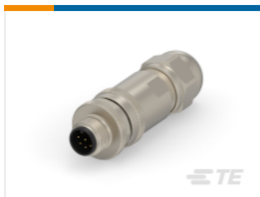
TE 产品编号T4111012081-000 M12 M, 8P GOLD A_CODE S SHIELDED PG9