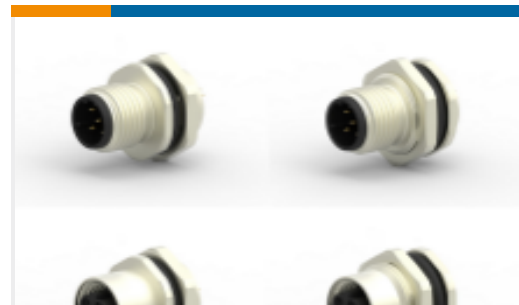
TE 产品编号T4130412051-000 M12 面板安装焊杯