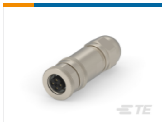
TE 产品编号T4110511041-000 M12 F, 4P GOLD D_CODE S SHIELDED PG7