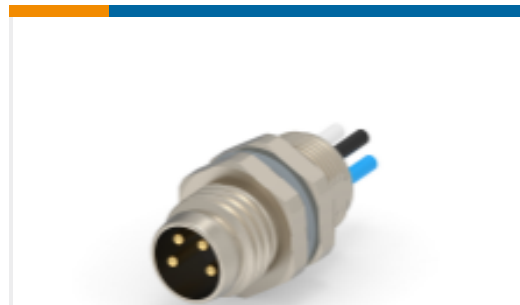
TE 产品编号T4072014041-001 M8.MLE.PNLFRONT.4POS.STR WIRE