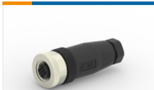
TE 产品编号T4110401041-000 M12,FEMALE,STRAIGHT,B CODE,4P, PG7,GOLD