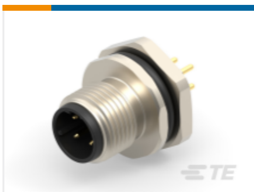
TE 产品编号T4142512041-000 M12,FRONT MOUNTING,MALE,D CODE,4P