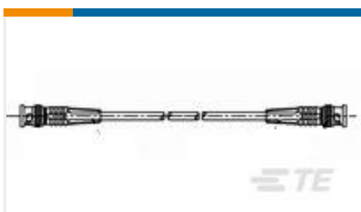
TE 产品编号1337769-5 50 OHM COAX BNC STR PLUG P99-E