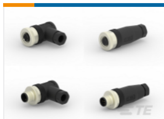
TE 产品编号T4110401051-000 M12 可现场安装非屏蔽式