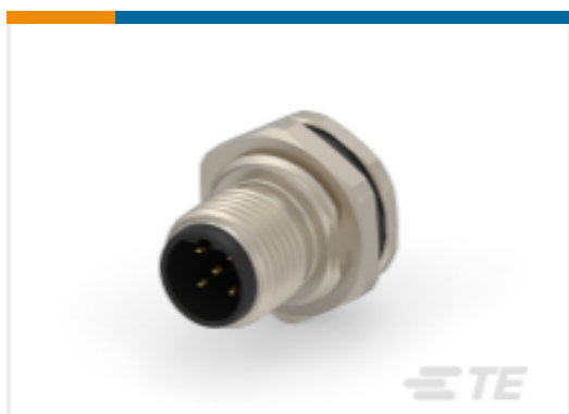
TE 产品编号T4171010405-001 M12,REAR MOUNTING,MALE,B,5P,0.2 M WIRE