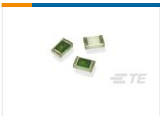
TE 产品编号8-1614352-2 RN 0805 392K 0.1% 10PPM 1K RL