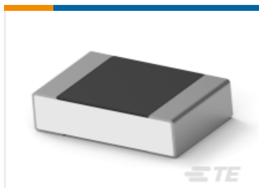
TE 产品编号9-2176376-5 RQ 0805 118K 0.1% 10PPM 1K RL