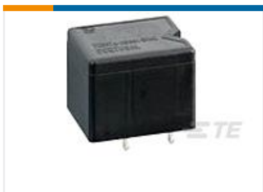
TE 产品编号1-1393277-7 V23076A3001D142