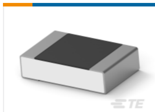
TE 产品编号9-2176376-4 RQ 0805 115K 0.1% 10PPM 1K RL