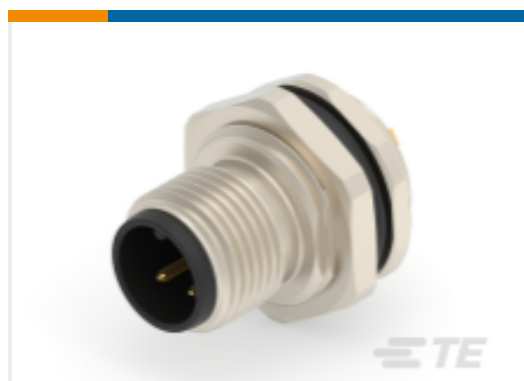
TE 产品编号T4130012031-000 M12,REAR MOUNT,MALE,A,3P, SOLDER WIRE