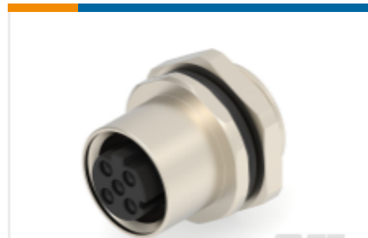
TE 产品编号T4133512031-000 M12,FRONT MOUNT,FEMALE,D,3P, SOLDER WIRE