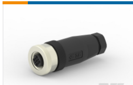
TE 产品编号T4110401031-000 M12,FEMALE,STRAIGHT,B CODE,3P, PG7,GOLD