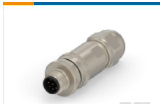
TE 产品编号T4111012081-000 M12 M, 8P GOLD A_CODE S SHIELDED PG9