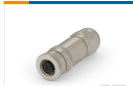
TE 产品编号T4110511041-000 M12 F, 4P GOLD D_CODE S SHIELDED PG7