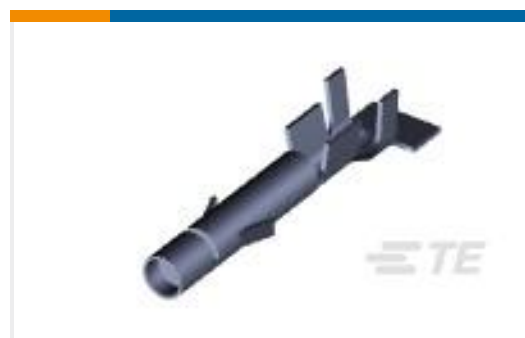
TE 产品编号926882-1 UMNL SOK 20-14 PTPBR