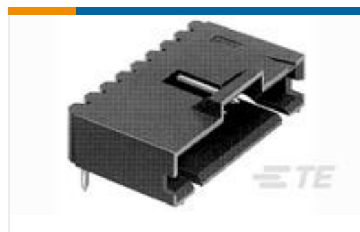
TE 产品编号6-103635-9 20 MTE HDR SRRA LTCH.100CL LF