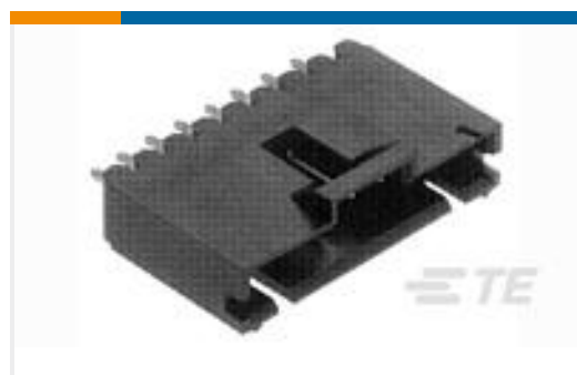
TE 产品编号6-103908-9 20 MTE HDR SRST LATCH W/HLDWN