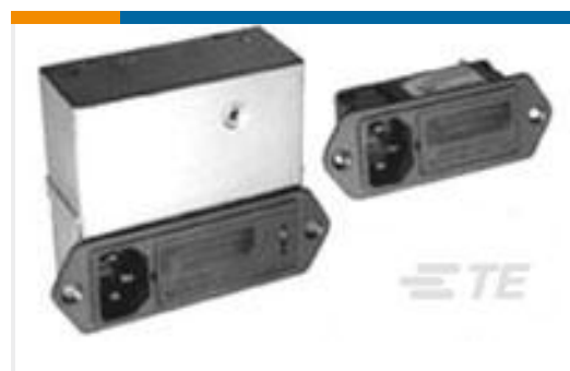
TE 产品编号3-6609128-5 6VM4S=F8103