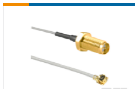
TE 产品编号CSI-RGFB-100-UFFR RP-SMA to U.FL/MHF1 100mm 1.13 OD