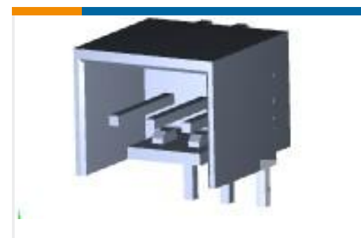
TE 产品编号3-644894-3 03P CST100 SHRD HDR ASSY LF