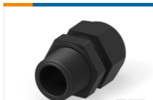
TE 产品编号1SNG601162R0000 EP-SG-NPT12-BL-B