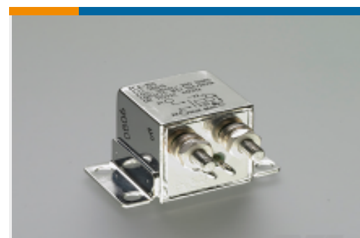
TE 产品编号4-1617815-8 FCA-150-KR4=RELAY