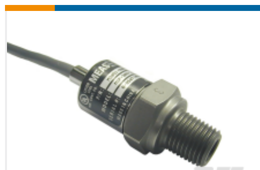
TE 产品编号M3021-000005-01KPG PRESS XDCR M3021-000005-01KPG