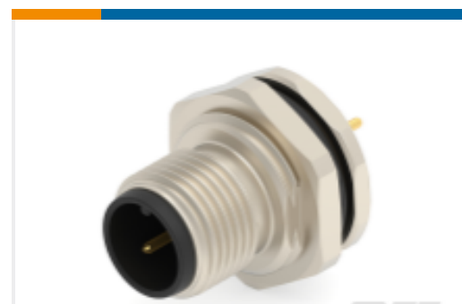
TE 产品编号T4140012021-000 M12,REAR MOUNTING,MALE,A CODE,2P