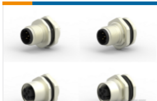
TE 产品编号T4130012051-000 M12 面板安装焊杯