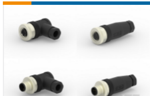
TE 产品编号T4110002031-000 M12 可现场安装非屏蔽式