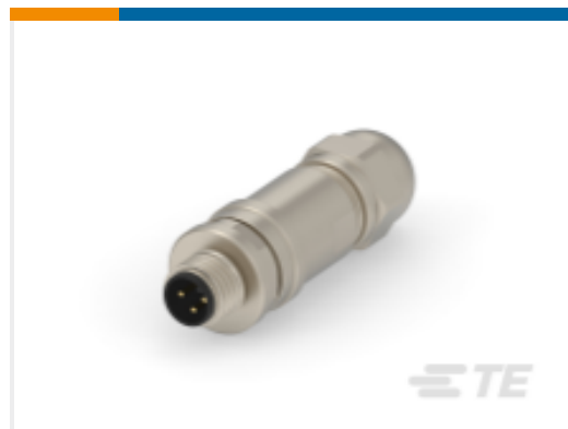
TE 产品编号T4111011031-000 M12 M, 3P GOLD A_CODE S SHIELDED PG7