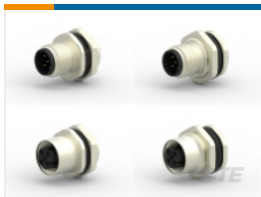
TE 产品编号T4133412031-000 M12 面板安装焊杯