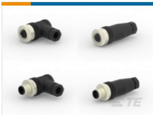
TE 产品编号T4110002041-000 M12 可现场安装非屏蔽式