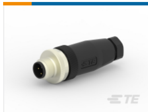
TE 产品编号T4111001041-000 RPC-M12-MS-4CON-PG7-MU