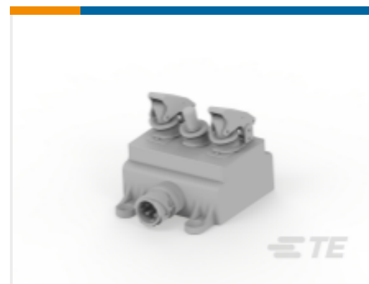
TE 产品编号K1150112 Toggle Switch 07-3-3-99 916