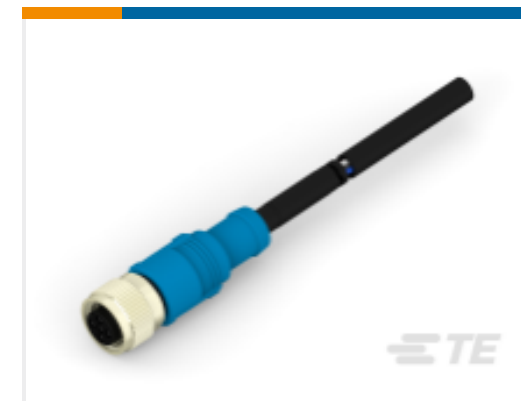
TE 产品编号T4161310003-004 RPC-M12-FS-3CON-PVC-3.0SH