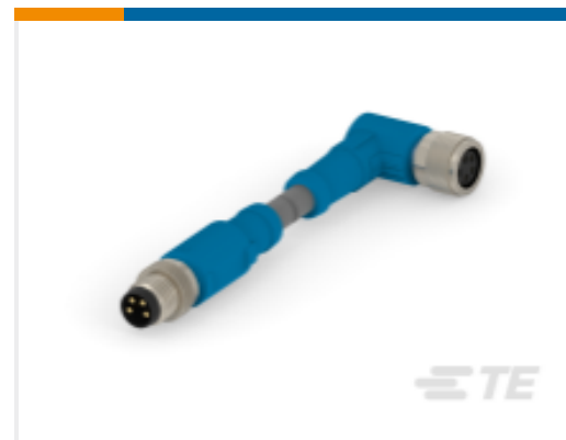
TE 产品编号T4062124004-001 RPC-M8-4MS-0.5SH-M8-4FR-PUR