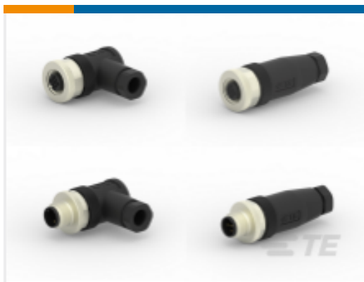
TE 产品编号T4111402051-000 M12 可现场安装非屏蔽式