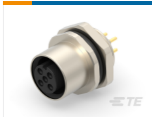
TE 产品编号T4143012041-000 M12,FRONT MOUNTING,FEMALE,A CODE,4P