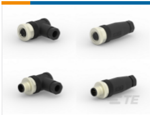
TE 产品编号T4113002041-000 M12 可现场安装非屏蔽式