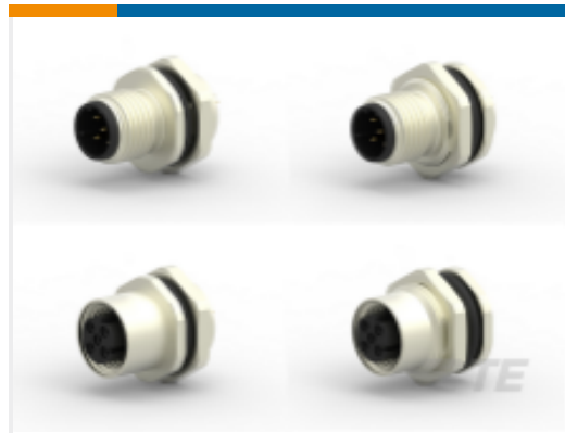
TE 产品编号T4132012041-000 M12 面板安装焊杯