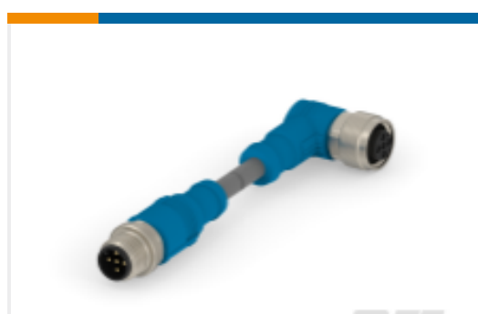
TE 产品编号T4162124005-001 RPC-M12-5MS-0.5SH-M12-5FR-PUR