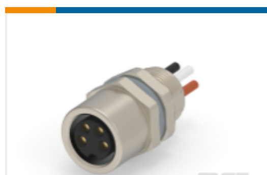
TE 产品编号T4073014041-001 M8.FMLE.PNLFRONT.4POS.STR WIRE