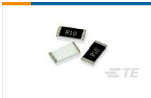
TE 产品编号1-2176057-3 RLP73M 3A R033 1% 1K RL