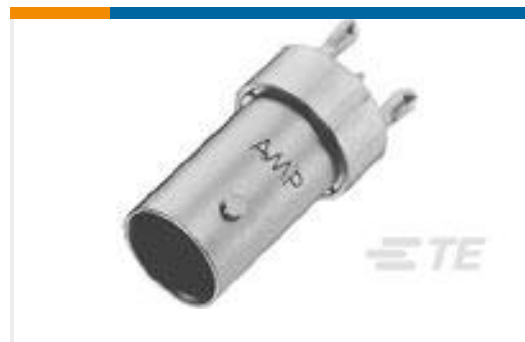
TE 产品编号222006-1 RECEPTACLE,PRESS FIT,COML BNC