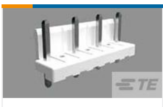
TE 产品编号1-1123724-4 3.96EP HDR ASSY 4(7)P NATURAL