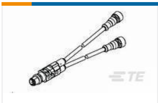
TE 产品编号1-2273107-1 M12 Y conn Male to 2xM12 Female A