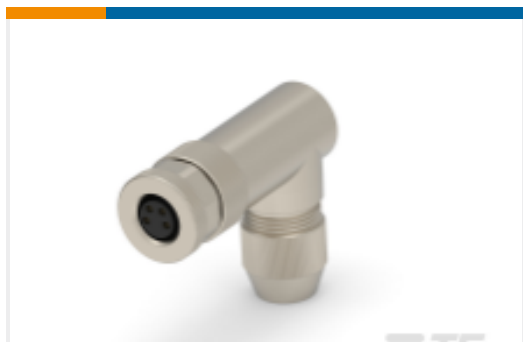
TE 产品编号T4012019041-000 M8,SCREW, FEMALE,R/A,SHIELD,4P, GOLD