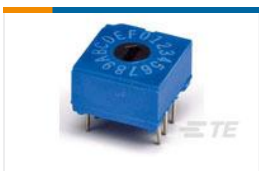
TE 产品编号1825008-4 DRD16RAE04=Rot Dip,R/A