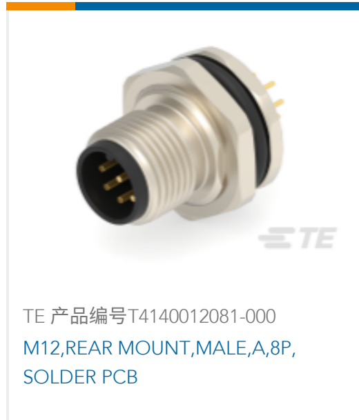
TE 产品编号T4140012081-000 M12,REAR MOUNT,MALE,A,8P, SOLDER PCB