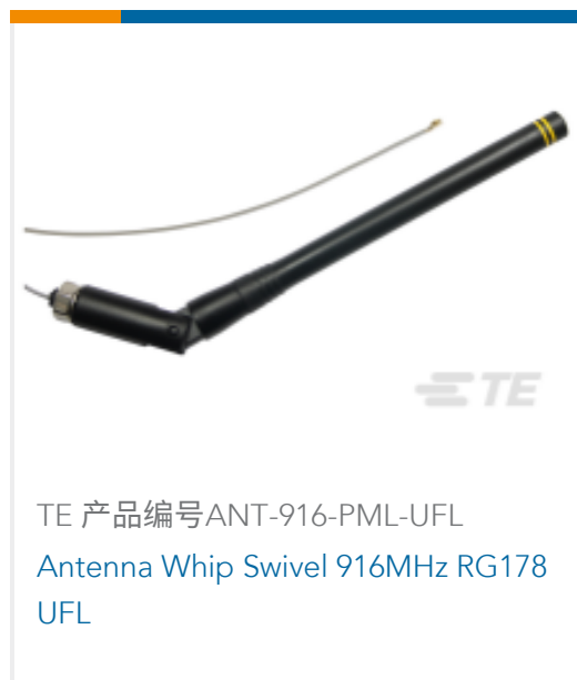
TE 产品编号ANT-916-PML-UFL Antenna Whip Swivel 916MHz RG178 UFL