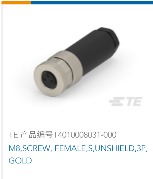
TE 产品编号T4010008031-000 M8,SCREW, FEMALE,S,UNSHIELD,3P, GOLD