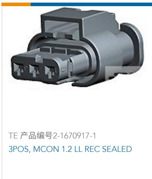
TE 产品编号2-1670917-1 3POS, MCON 1.2 LL REC SEALED