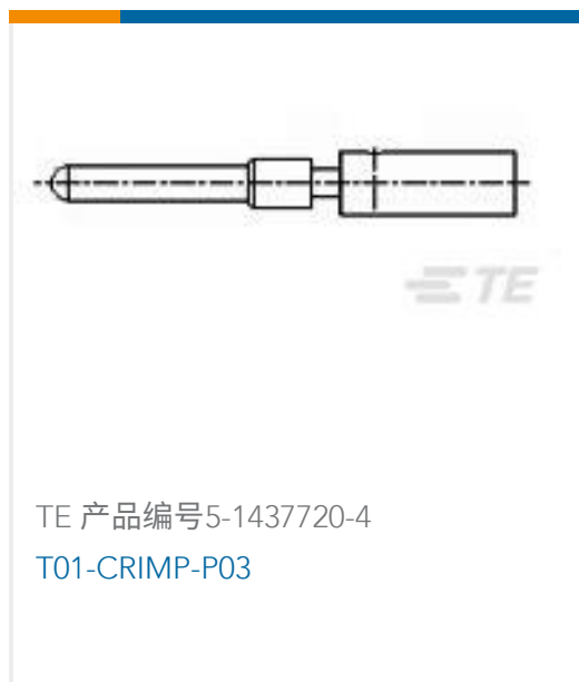
TE 产品编号5-1437720-4 T01-CRIMP-P03