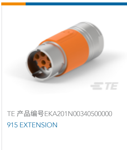
TE 产品编号EKA201N00340500000 915 EXTENSION