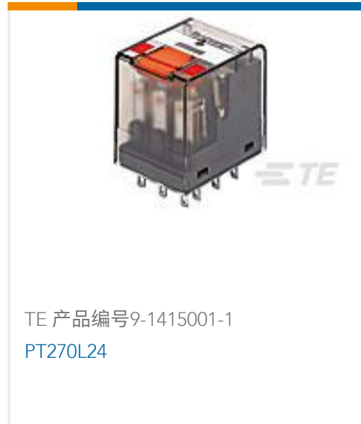
TE 产品编号9-1415001-1 PT270L24