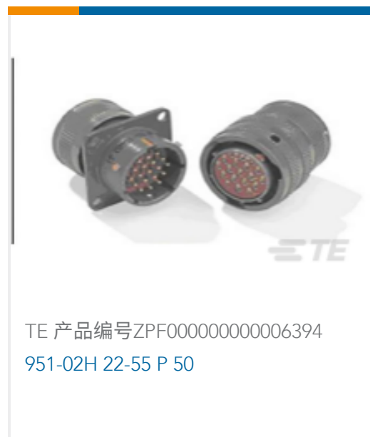
TE 产品编号ZPF000000000006394 951-02H 22-55 P 50