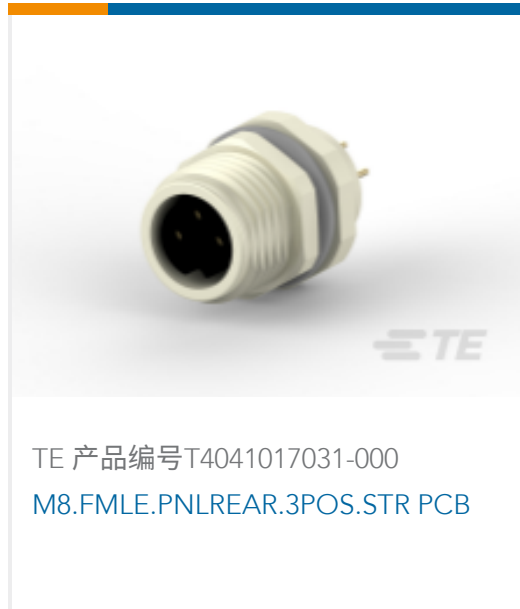
TE 产品编号T4041017031-000 M8.FMLE.PNLREAR.3POS.STR PCB