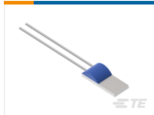
TE 产品编号NB-PTCO-037 Pt100, 2.0x5.0, Class A, PTFD101A1G0