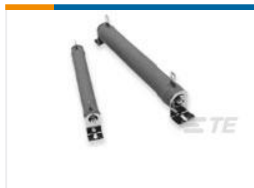
TE 产品编号1879455-6 TE 1500W 2R7 5% Bracket