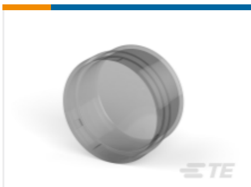
TE 产品编号2306128-1 COVER, LIGHT CONTROLLER, 76MM DIA,SHORT