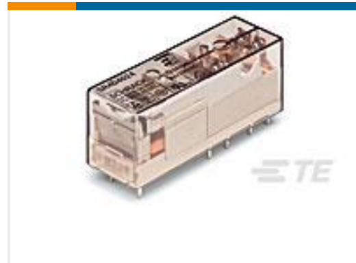
TE 产品编号1-1415055-1 SR4D4018