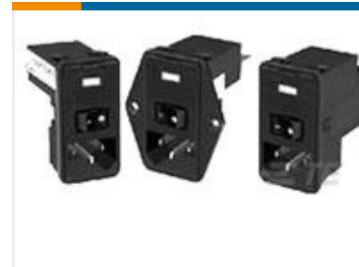
TE 产品编号4-1609153-9 PS0S0DM6E=C7093