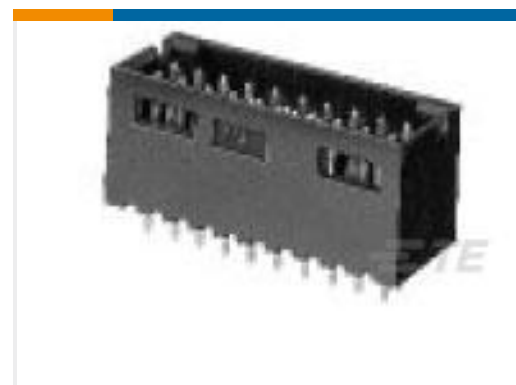
TE 产品编号5-103168-4 12 MODII HDR DRST SHRD .100CL