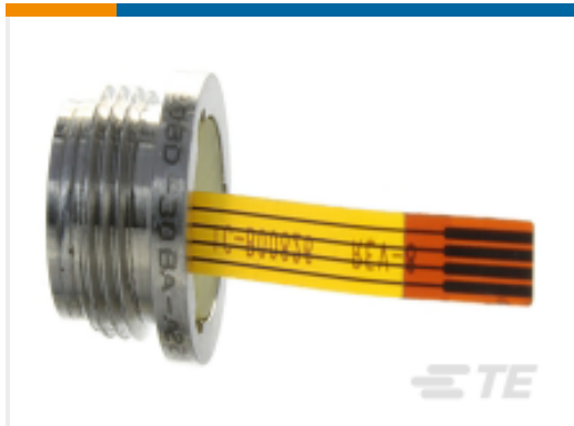
TE 产品编号89BSD-006BA-A 6 BARA 316L DIGITAL PRESSURE SENSOR