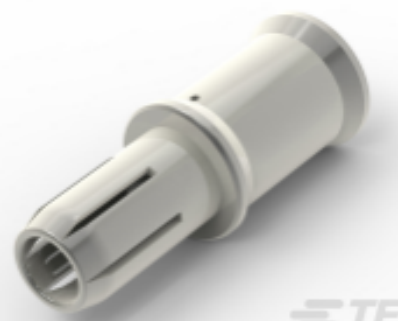
TE 产品编号 T2400002160-000 CSF-16