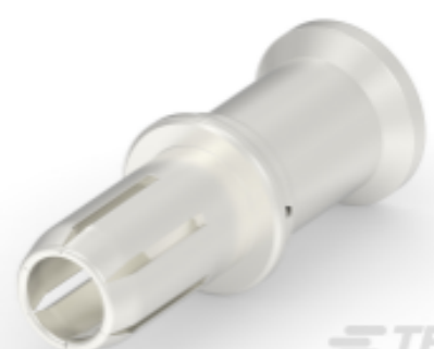
TE 产品编号 T2400002160-001 CSF-16-B