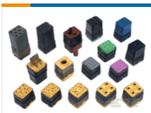
TE 产品编号ZPF000000000203708 DMC-M 99-10 PC