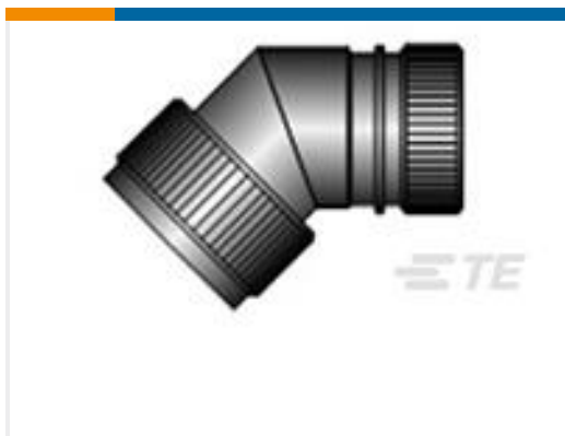
TE 产品编号CZ6862-000 HEX40-AC-45-25-A12-3