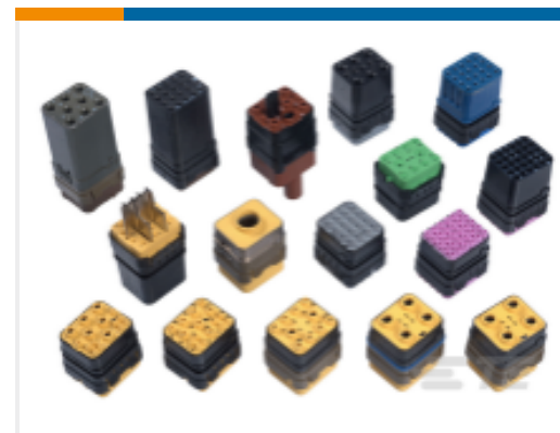
TE 产品编号ZPF000000000202094 DMC-M 0402 AW 01