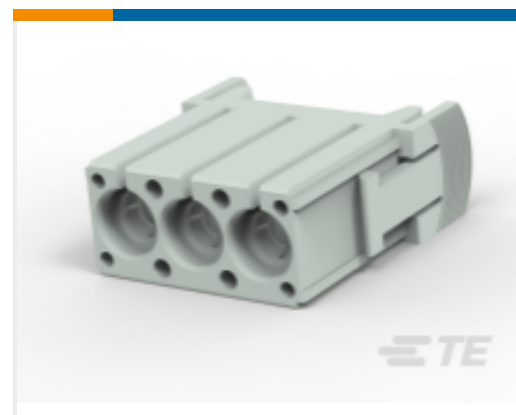
TE 产品编号T2111032301-000 HMN-PA3