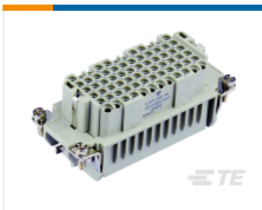
TE 产品编号T2030722201-000 HDD-072-F