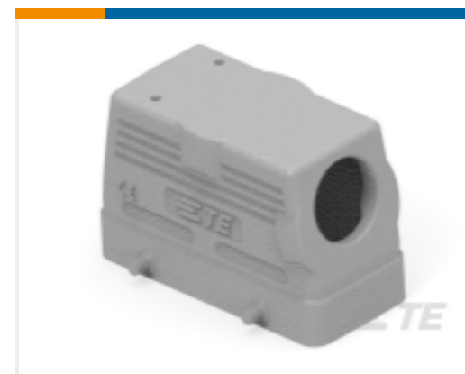
TE 产品编号T1210160121-200 H16B-TS-PG21