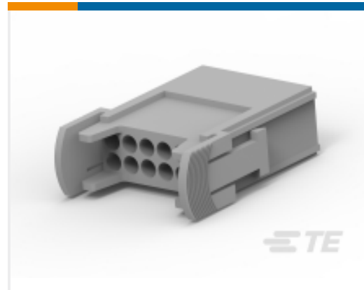
TE 产品编号T2111122101-000 HMN-012-M