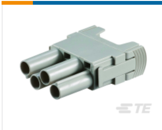
TE 产品编号T2111042201-000 HMN-004-F