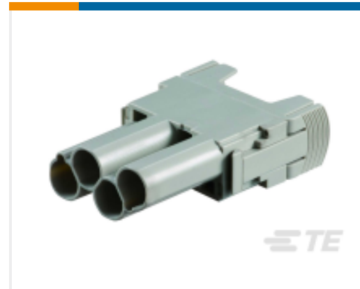
TE 产品编号T2111042101-000 HMN-004-M