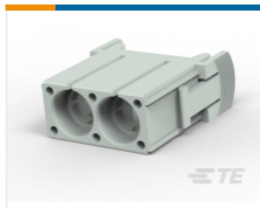
TE 产品编号T2111022301-000 HMN-PA2