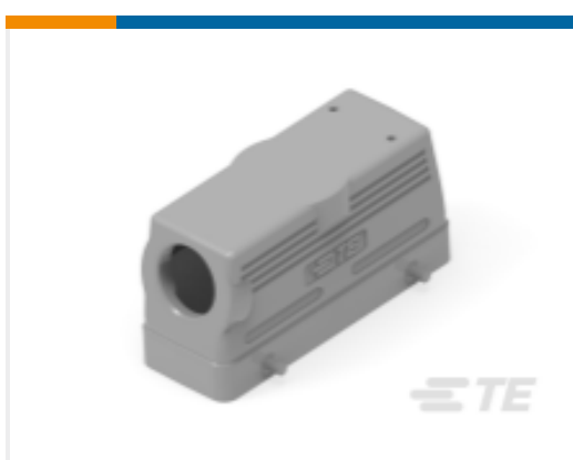
TE 产品编号T1210240121-100 H24B-TS-PG21