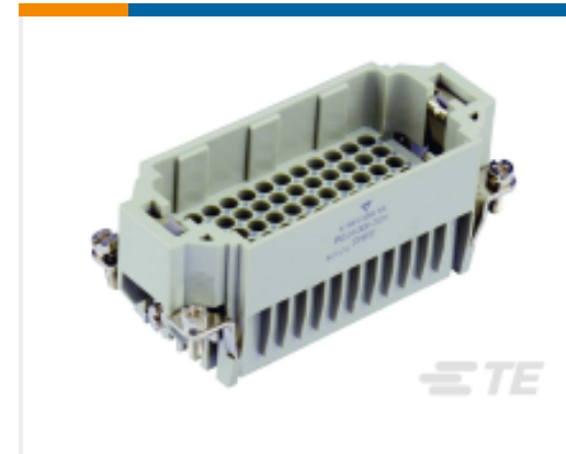
TE 产品编号T2030722101-000 HDD-072-M