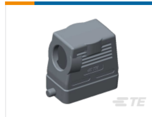
TE 产品编号T1330100121-000 H10B-TSH-RO-PG21