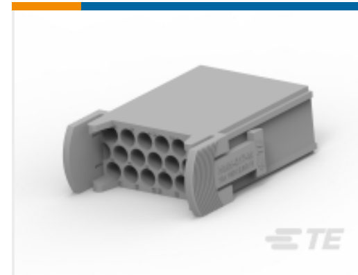
TE 产品编号T2111172101-000 HMN-017-M