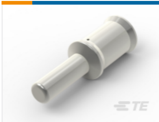
TE 产品编号T2400001100-000 CSM-10