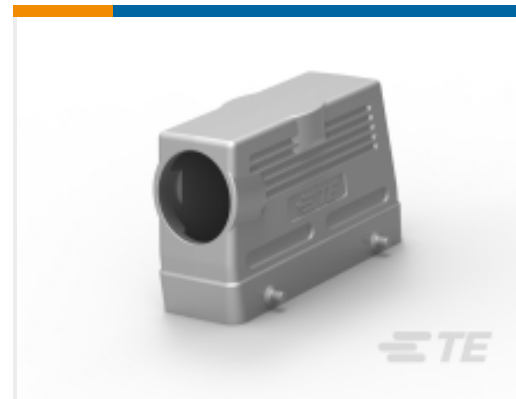
TE 产品编号T1230240140-000 H24B-TSH-M40