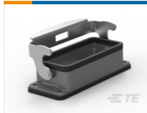
TE 产品编号T1500162000-000 H16B-AGS-LB