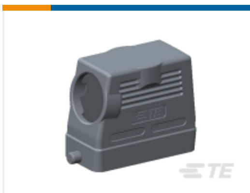
TE 产品编号T1330160129-000 H16B-TSH-RO-PG29