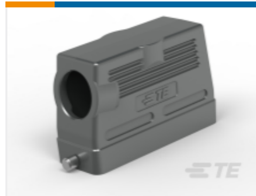
TE 产品编号T1330240129-000 H24B-TSH-RO-PG29