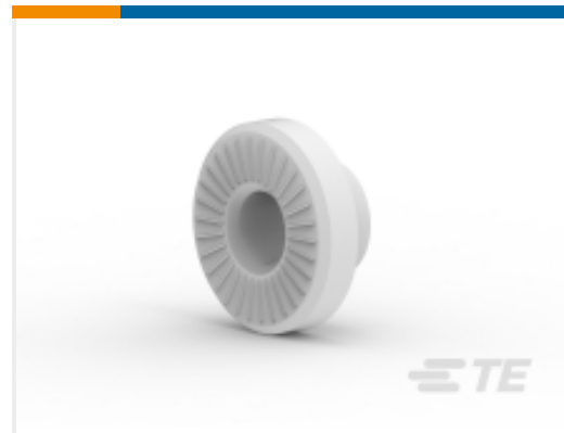
TE 产品编号T0930050457-000 FLOATING WASHER