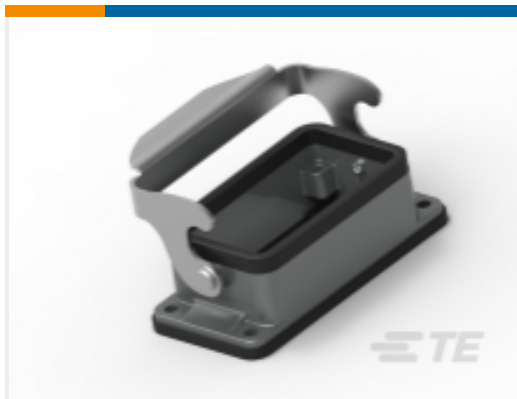
TE 产品编号T1500102000-000 H10B-AGS-LB