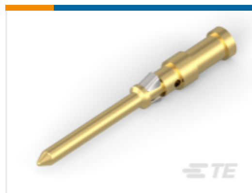
TE 产品编号T2020011005-000 DDM-0.5