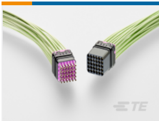
TE 产品编号ZPF000000000203399 DMC-MR 30-23 PD