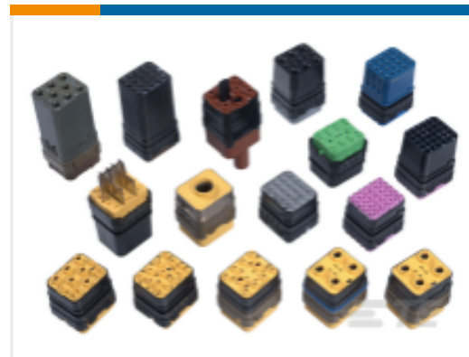
TE 产品编号ZPF000000000202094 DMC-M 0402 AW 01