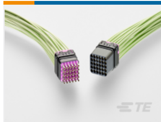
TE 产品编号ZPF000000000203398 DMC-MR 30-23 PC