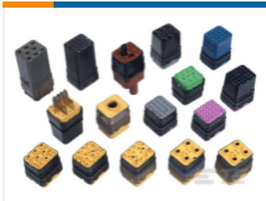
TE 产品编号ZPF000000000203708 DMC-M 99-10 PC