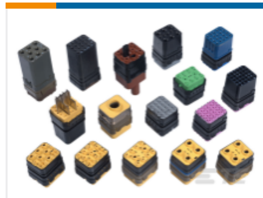
TE 产品编号ZPF000000000202094 DMC-M 0402 AW 01