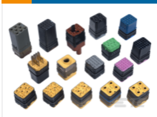
TE 产品编号ZPF000000000203708 DMC-M 99-10 PC