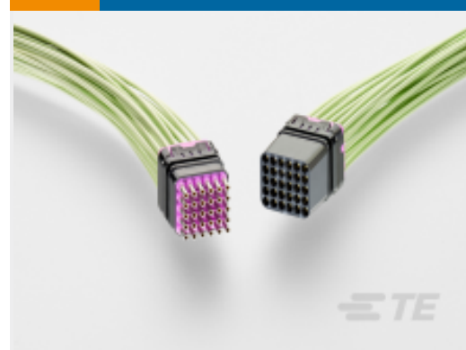
TE 产品编号ZPF000000000203398 DMC-MR 30-23 PC