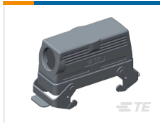
TE 产品编号T1250242121-000 H24B-TSB-PG21