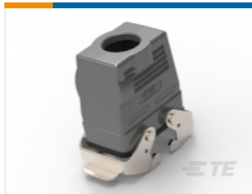
TE 产品编号T1750102132-000 H10B-TBFH-M32