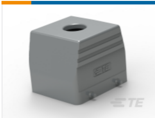
TE 产品编号T1220320129-000 H32B-TG-PG29