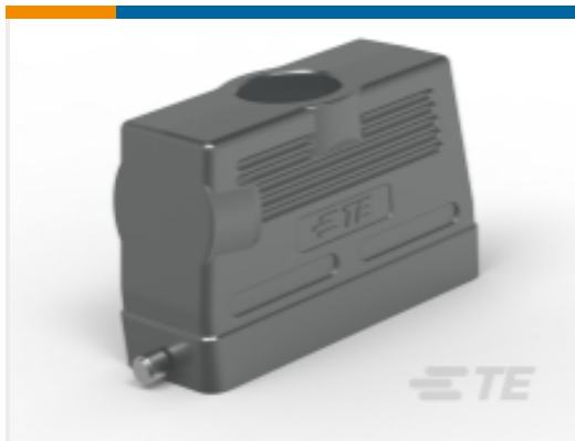
TE 产品编号T1340240129-000 H24B-TGH-RO-PG29