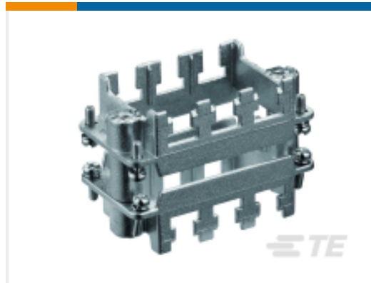
TE 产品编号T2070104001-000 H10BN-T3