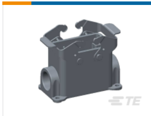
TE 产品编号T1440102120-000 H10B-SGR-M20