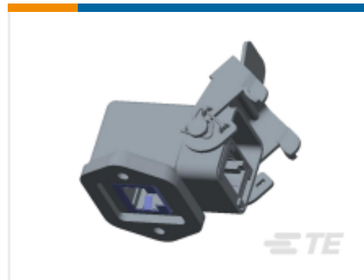
TE 产品编号T1549033145-000 H3A-RJ45-MAGS