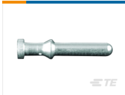
TE 产品编号T2040001025-000 CMM-2.5