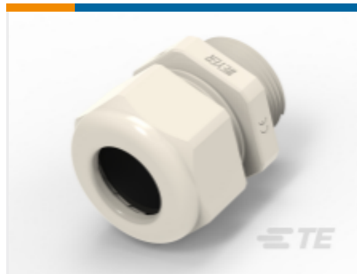
TE 产品编号T3209401222-001 HSK-M40G