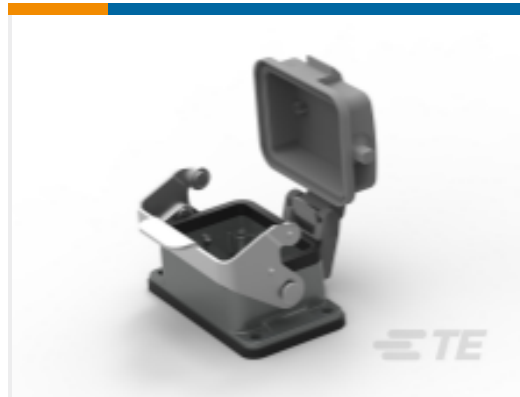
TE 产品编号T1510062100-000 H6B-ADS