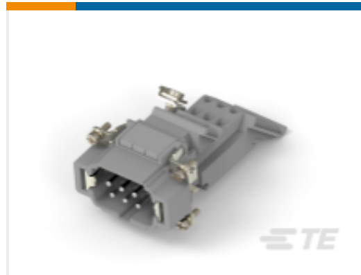
TE 产品编号T2100063101-000 HEAV-006-MS