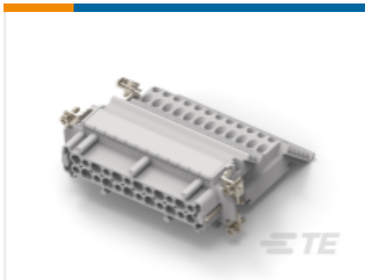
TE 产品编号T2100243201-000 HEAV-024-FS