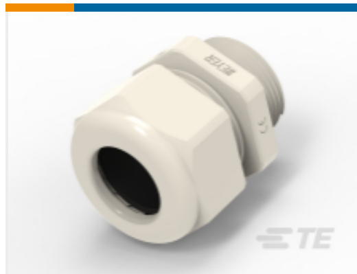
TE 产品编号T3209211211-000 HSK-P21G-H