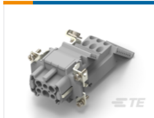
TE 产品编号T2100063201-000 HEAV-006-FS