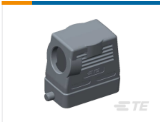
TE 产品编号T1330100121-000 H10B-TSH-RO-PG21