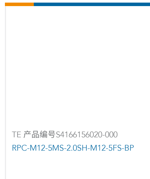
TE 产品编号S4166156020-000 RPC-M12-5MS-2.0SH-M12-5FS-BP