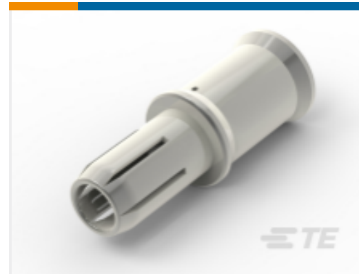
TE 产品编号T2400002160-000 CSF-16