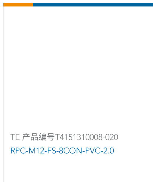
TE 产品编号T4151310008-020 RPC-M12-FS-8CON-PVC-2.0