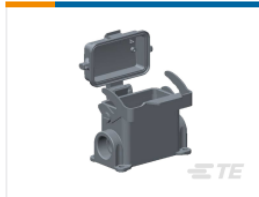
TE 产品编号T1620103216-000 H10B-SDR-LB-2PG16