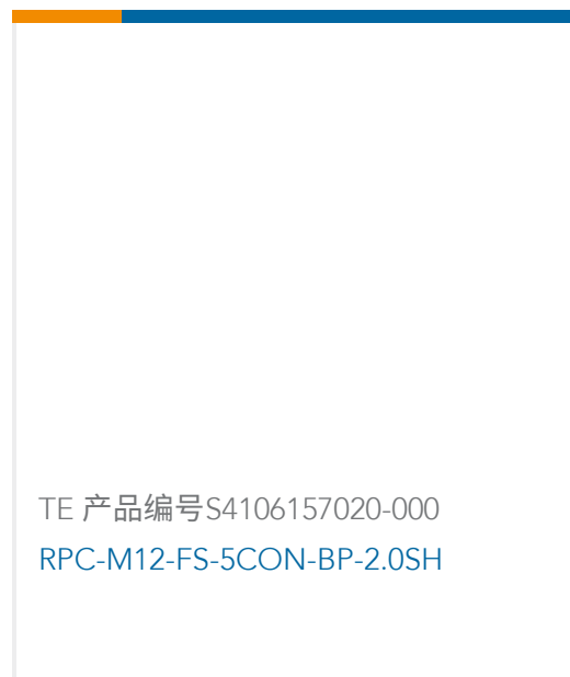
TE 产品编号S4106157020-000 RPC-M12-FS-5CON-BP-2.0SH