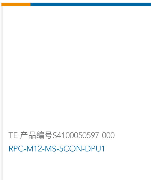
TE 产品编号S4100050597-000 RPC-M12-MS-5CON-DPU1