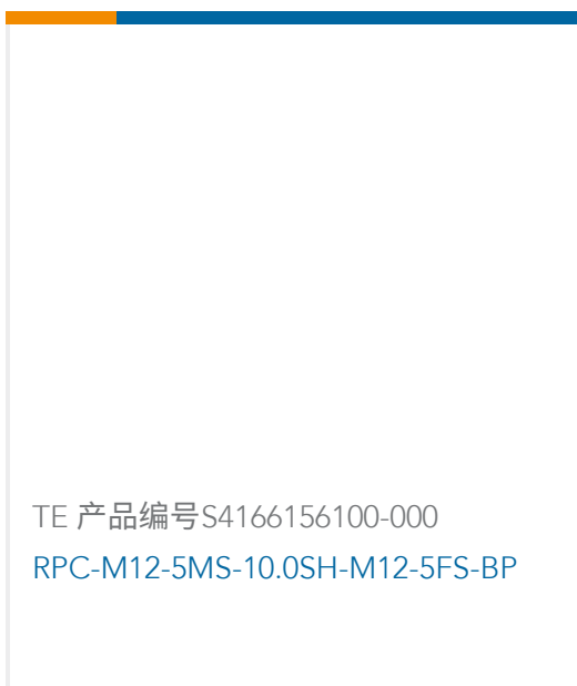
TE 产品编号S4166156100-000 RPC-M12-5MS-10.0SH-M12-5FS-BP