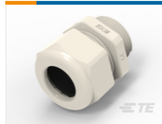
TE 产品编号T3209401222-001 HSK-M40G