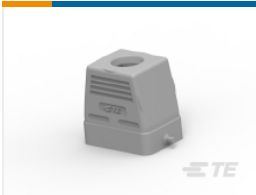
TE 产品编号T1320060121-000 H6B-TG-PG21