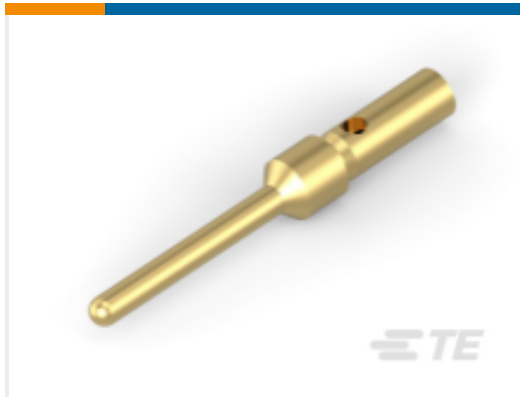
TE 产品编号T2070011008-000 DAM-08