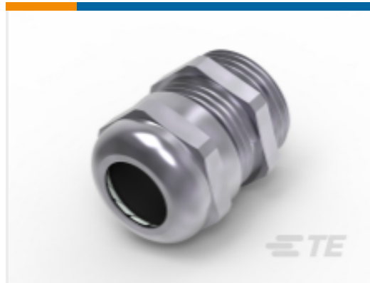
TE 产品编号T3609210111-000 DLX-21-MTS