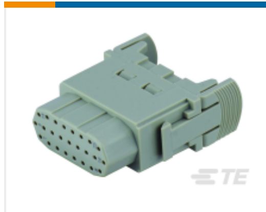
TE 产品编号T2111252201-000 HMN-025-F