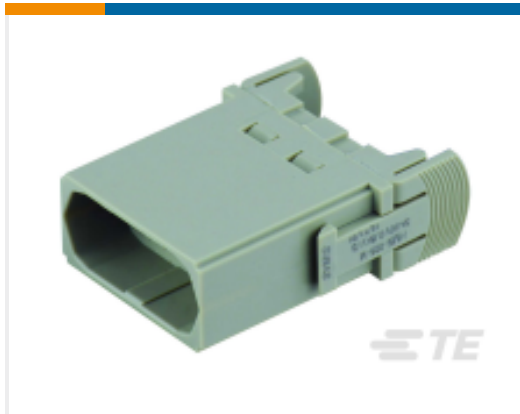
TE 产品编号T2111252101-000 HMN-025-M