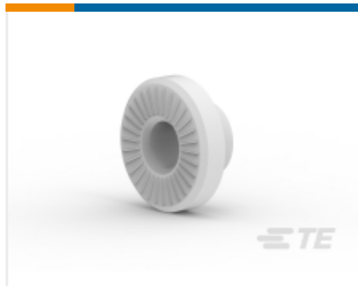
TE 产品编号T0930050457-000 FLOATING WASHER