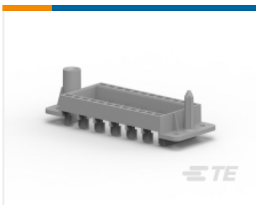
TE 产品编号T2071244201-000 H24BP-T6-F DOCKING FRAME_FIXED