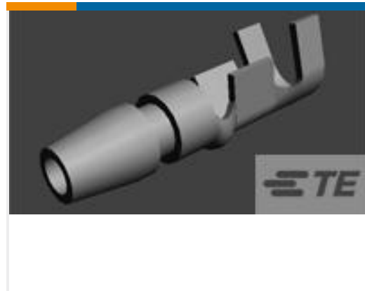
TE 产品编号170020-1 SHUR PLUG 20-14 MM2 TPBR