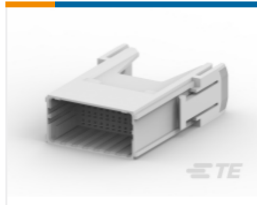
TE 产品编号2312729-2 HMN-HD1-48-M