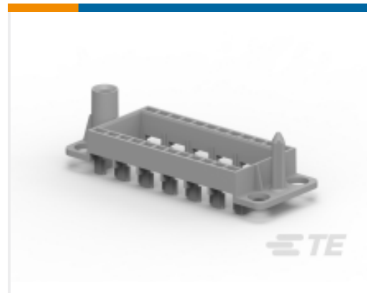
TE 产品编号T2071244101-000 H24BP-T6-M DOCKING FRAME_FLOATING