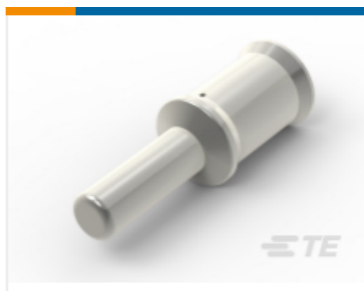
TE 产品编号T2400001250-000 CSM-25