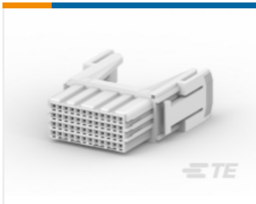
TE 产品编号2312730-2 HMN-HD1-48-F