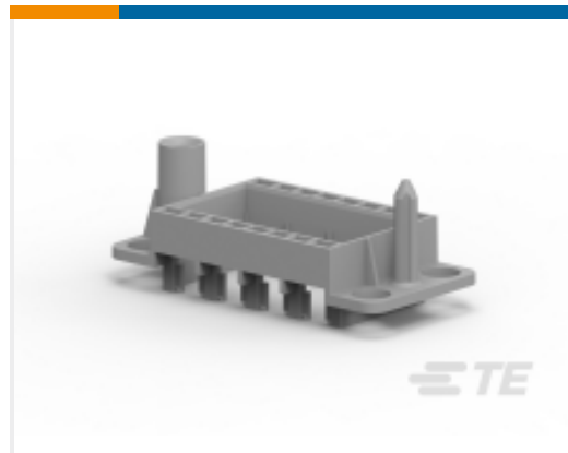
TE 产品编号T2071164101-000 H16BP-T4-M DOCKING FRAME_FLOATING