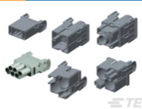
TE 产品编号 CAT-H3399-H648 HDC HMN Modular System, Rail Compliant