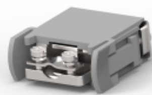
TE 产品编号 T2111092201-000 HMN-009-F