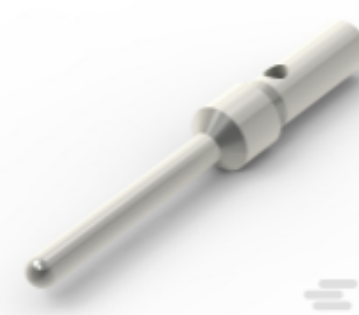
TE 产品编号 T2070001033-000 CAM-33