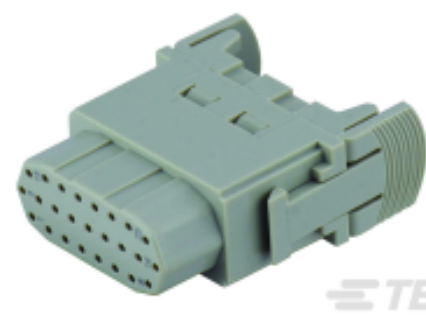
TE 产品编号 T2111252201-000 HMN-025-F