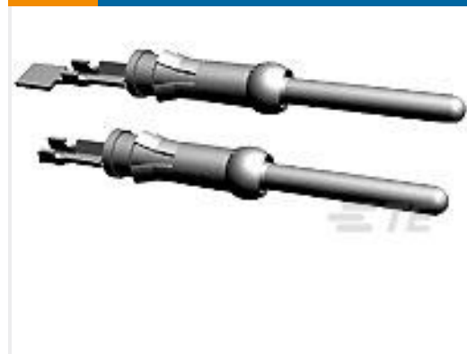
TE 产品编号1-66103-8 III+ PIN,24-20,TIN,LP