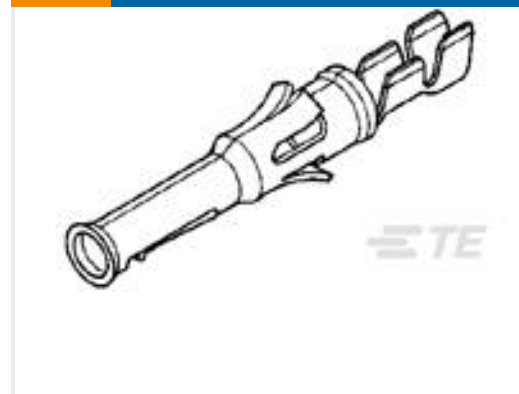
TE 产品编号66594-1 TYPE VI SKT CONT,MULTIMATE