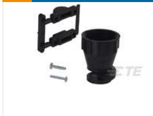
TE 产品编号206070-8 CABLE CLAMP KIT #17