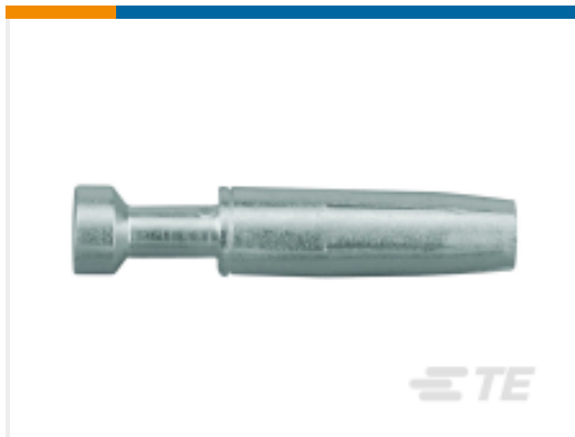
TE 产品编号T2030002010-000 CEF-1.0