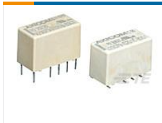
TE 产品编号5-1393788-8 V23079D1005B301