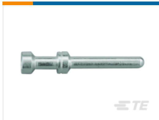
TE 产品编号T2030001010-000 CEM-1.0