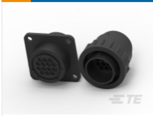
TE 产品编号182641-1 欧洲、中东和非洲 CPC