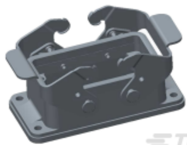
TE 产品编号 T1410102000-000 H10B-AG