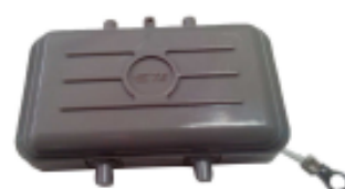
TE 产品编号 T1010102100-000 H10B-KDBP