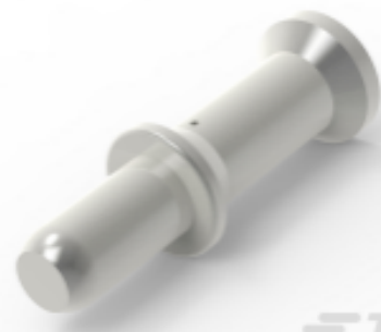
TE 产品编号 T2050001035-000 CNM-35