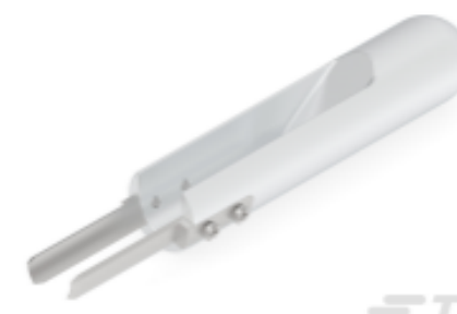
TE 产品编号 T3100000035-000 REMOV-HMN-D2