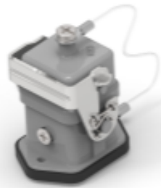
TE 产品编号T2120082201-100 ZGG-8D (1-2 / 4-5 / 7-8)