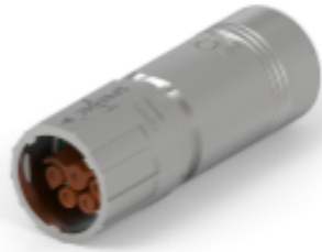
TE 产品编号HSA002N00420100000 723 HTEC PLUG, SPEEDTEC