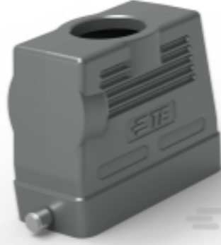
TE 产品编号T1340160125-000 H16B-TGH-RO-M25