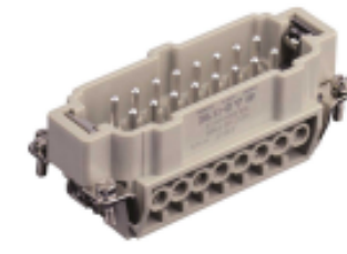
TE 产品编号T2040322101-000 HE-016-M 17-32