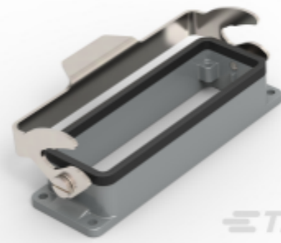
TE 产品编号T1500243000-000 H24B-AG-LB