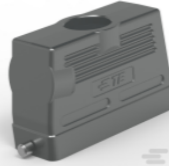
TE 产品编号T1340240132-000 H24B-TGH-RO-M32