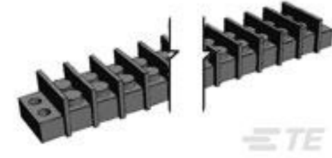
TE 产品编号3-1546306-0 30P.374" DR BARRIER STRIP