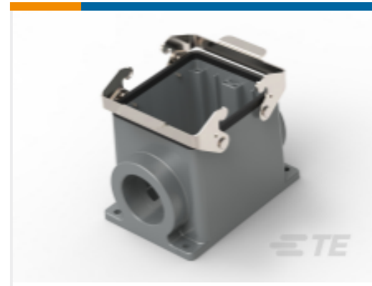
TE 产品编号 T1440322129-000 H32B-SGR-PG29