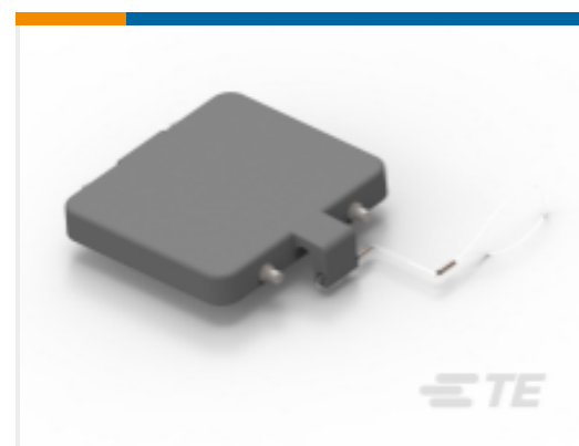
TE 产品编号 T1000321320-000 H32B-KDBP-BOM