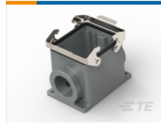
TE 产品编号 T1440322132-000 H32B-SGR-M32