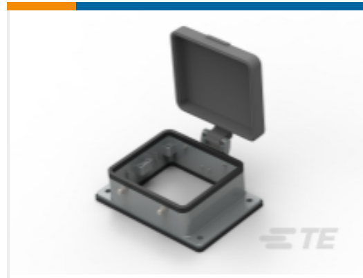
TE 产品编号 T1430320000-000 H32B-AD-BO