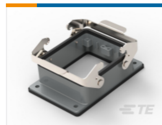
TE 产品编号 T1410322000-100 H32B-AG