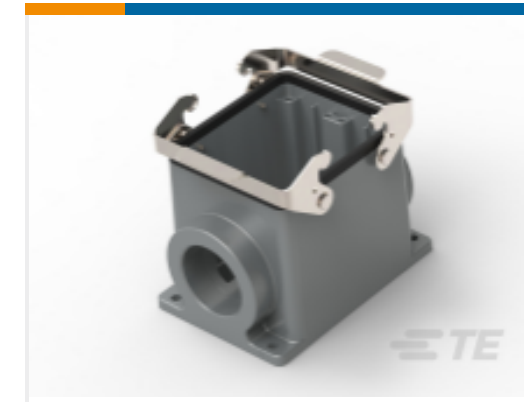
TE 产品编号 T1440322136-000 H32B-SGR-PG36