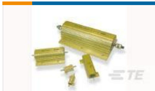
TE 产品编号1-1625999-4 HSC100 1R0 5%