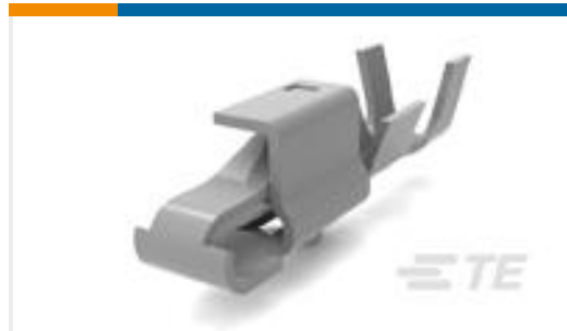
TE 产品编号770522-2 SL156 RECEPT AUNI/PHBZ L/P