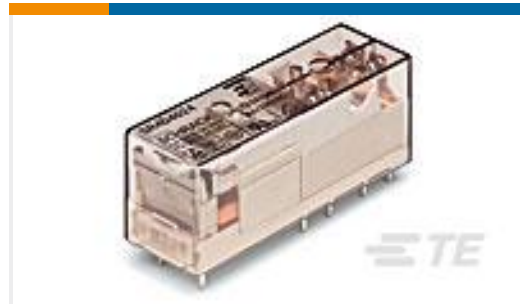
TE 产品编号4-1415053-1 SR4M4024