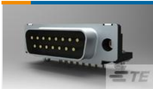
TE 产品编号5747841-4 15 MSFL PLUG RA 318 (IN,FM,BL)