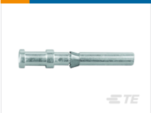
TE 产品编号T2020002005-000 CDF-0.5