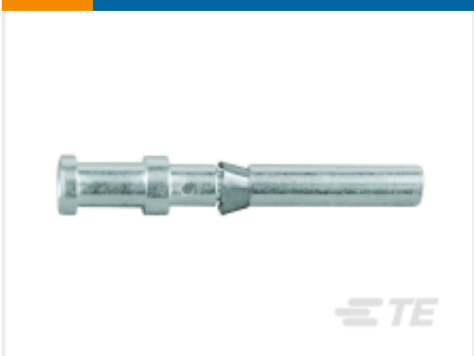
TE 产品编号T2020002010-000 CDF-1.0