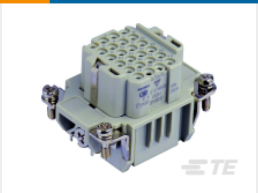
TE 产品编号T2030243201-000 HDD-024-FJ