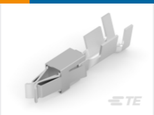
TE 产品编号927777-3 JUNIOR POWER TIMER CONTACT