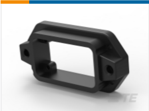
TE 产品编号T1932100000-009 H10BPR-AGC-EMC-C