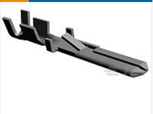
TE 产品编号928794-2 FF 110 TAB PTP CUZN30