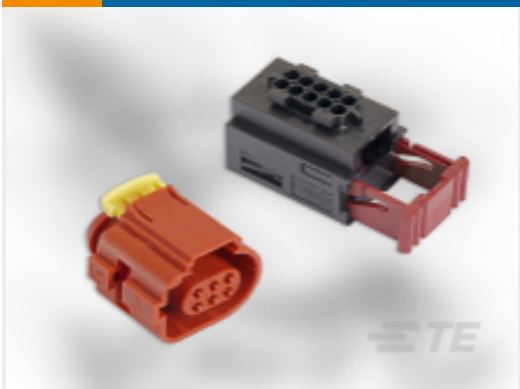
TE 产品编号929504-2 Timer Connector Housing