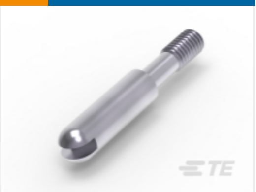
TE 产品编号T0931000423-000 CODING-PIN-M3-TM