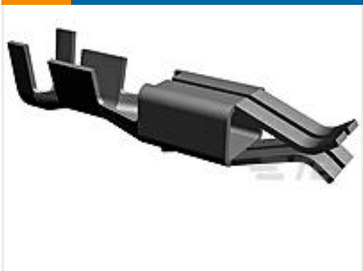
TE 产品编号925590-2 MINI SPRING RECEPTACLE