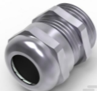
TE 产品编号 T3609200102-000 DLX-20-M