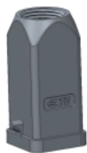
TE 产品编号 T1329030120-000 H3A-MTG-M20