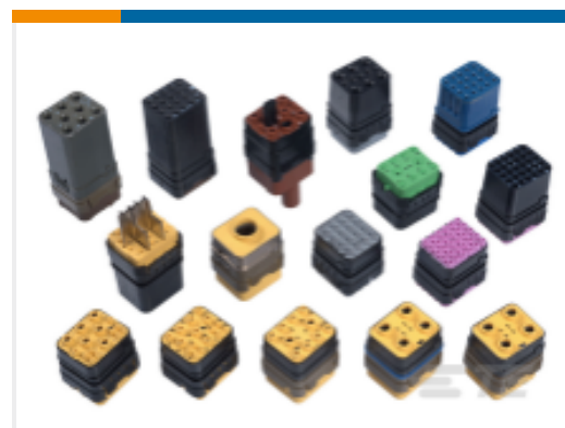
TE 产品编号ZPF000000000202094 DMC-M 0402 AW 01