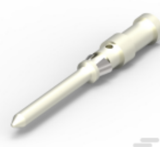
TE 产品编号 T2020001025-000 CDM-2.5