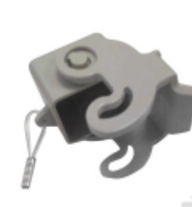
TE 产品编号 T1010031100-000 H3A-KDTP