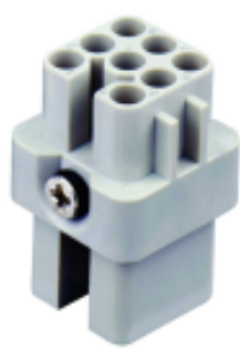
TE 产品编号 T2020082201-001 HD-008-F