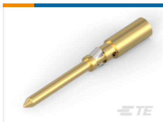
TE 产品编号T2020011025-000 DDM-2.5