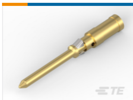
TE 产品编号T2020011015-000 DDM-1.5