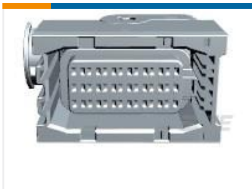
TE 产品编号1-1534127-1 AMP MCP 2.8 SOCKET HSG.,21POS. ASSY