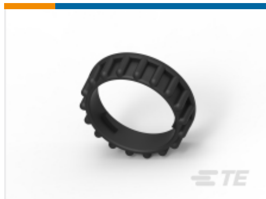
TE 产品编号965687-1 FIXING RING