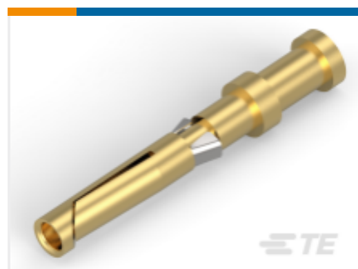
TE 产品编号T2020012010-000 DDF-1.0