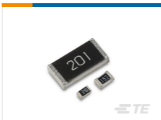
TE 产品编号1-2176328-5 CRGP 1206 150R 1%