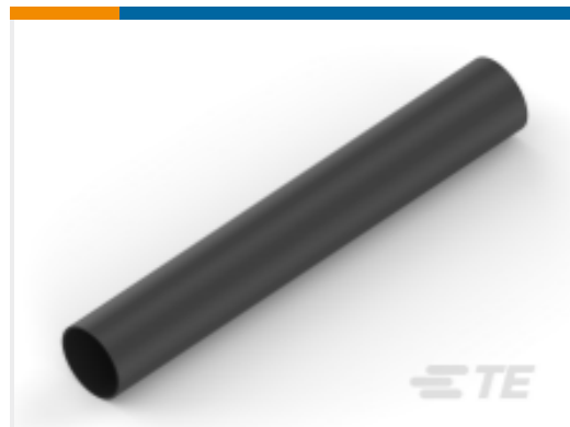
TE 产品编号NB11802001 ATUM-8/2-0-STK