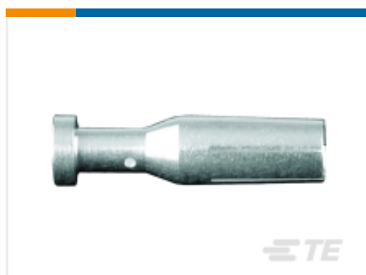
TE 产品编号T2040002040-000 CMF-4.0