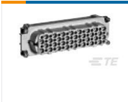
TE 产品编号2-1103033-3 HD.64.BU.C