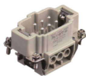
TE 产品编号 T2040062101-000 HE-006-M