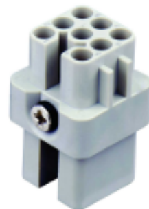
TE 产品编号T2020082201-000 HD-008-F