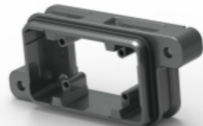
TE 产品编号 T1930062000-000 H6BPR-AG