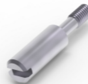
TE 产品编号T0931003003-000 CODING-PIN-M3