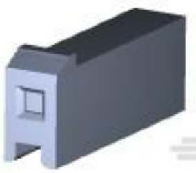
TE 产品编号640250-1 01P SL156 HSG W/LCK RAMP NATL