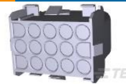
TE 产品编号1-480711-9 15P UMNL CAP HSG BLK