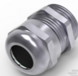
TE 产品编号 T3609160101-000 DLX-16-MS