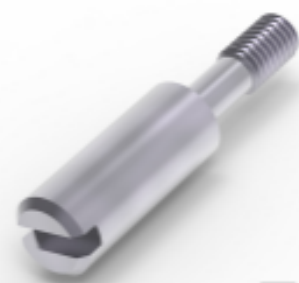
TE 产品编号T0931003003-000 CODING-PIN-M3