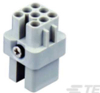
TE 产品编号T2020082201-000 HD-008-F