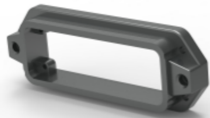
TE 产品编号 T1932242000-000 H24BPR-AGC