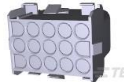
TE 产品编号1-480711-9 15P UMNLCAP HSG BLK