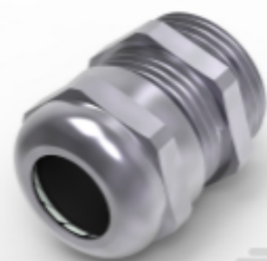
TE 产品编号 T3609400102-000 DLX-40-M