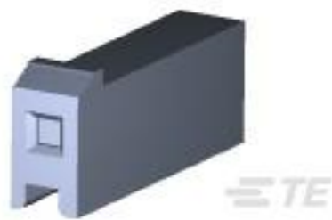
TE 产品编号640250-1 01P SL156 HSG W/LCK RAMP NATL