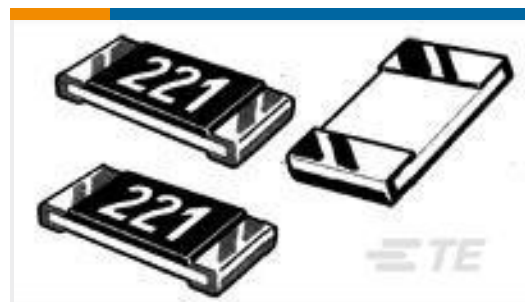
TE 产品编号2176070-1 3521 10R 1% 2W