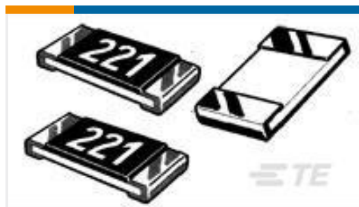
TE 产品编号2176232-7 3522 240K 1% 3W