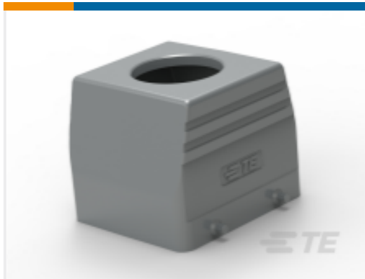
TE 产品编号T1220320136-000 H32B-TG-PG36