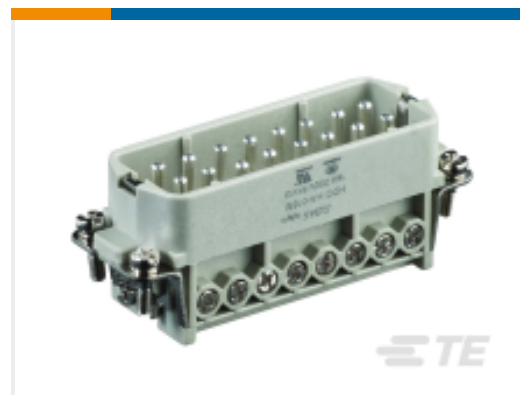
TE 产品编号 T2010162101-000 HA-016-M