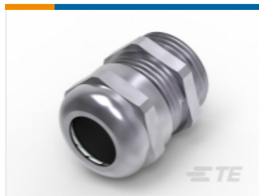
TE 产品编号 T3609200102-000 DLX-20-M