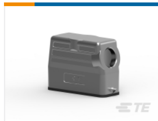
TE 产品编号 T1319160120-000 H16A-TS-M20