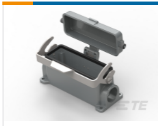
TE 产品编号T1620243125-000 H24B-SDR-LB-M25