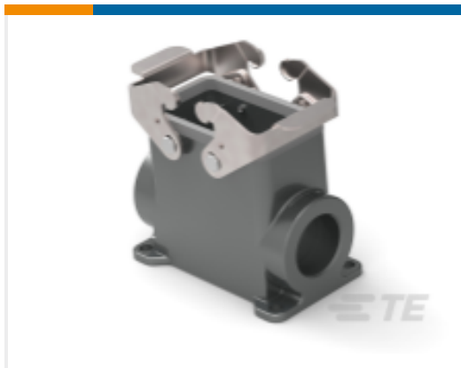
TE 产品编号T1470102121-000 H10B-SGRH-PG21