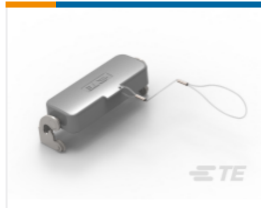
TE 产品编号T1019161201-001 H16A-KDTMS