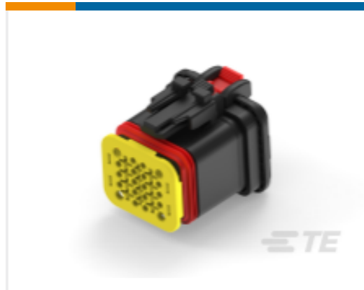
TE 产品编号2350890-1 20POS, HYBRID, SOC HSG ASSY, SLD, COD A