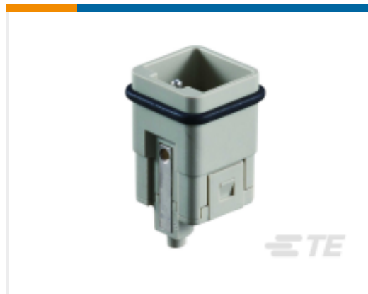
TE 产品编号T2080072101-000 HQ-007-M