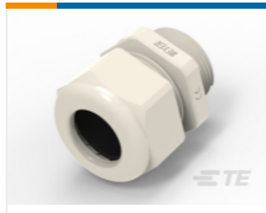
TE 产品编号T3209111201-000 HSK-P11G