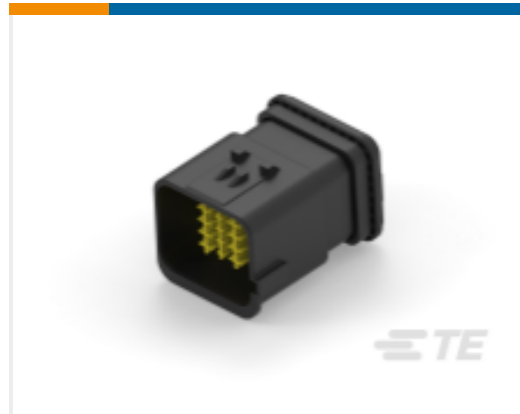
TE 产品编号2350891-1 20POS, HYBRID, PIN HSG ASSY, SLD, COD A