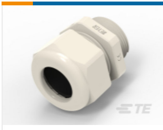
TE 产品编号T3209201222-001 HSK-M20G