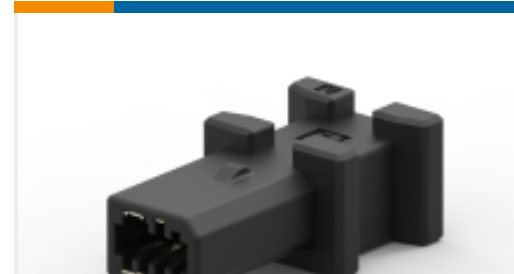
TE 产品编号1971153-1 CONN ASSY INDUSTRIAL MINI I/O