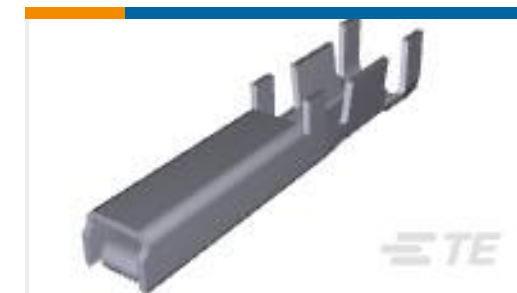
TE 产品编号1-917511-2 DYNAMIC D-3 REC CONT. 2L AU 0.38 L/P