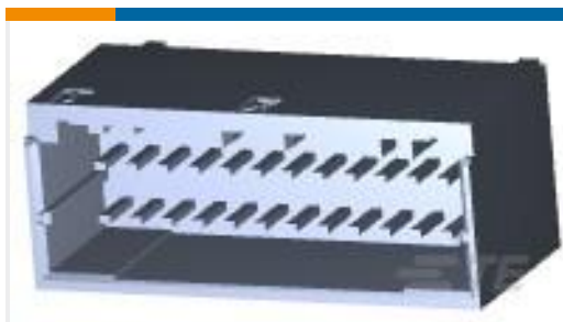
TE 产品编号1-1827872-3 DYNAMIC 1100D HDR ASSY V 26P XBLACK GOLD