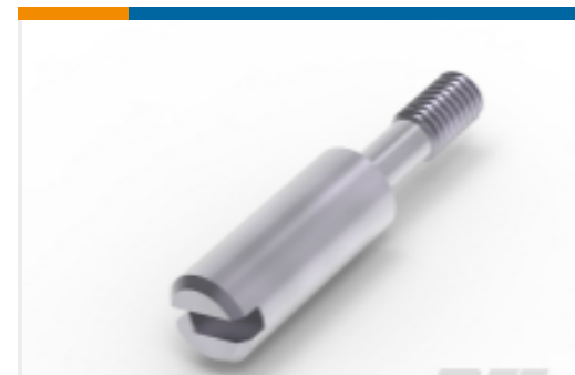
TE 产品编号T0931003003-000 CODING-PIN-M3