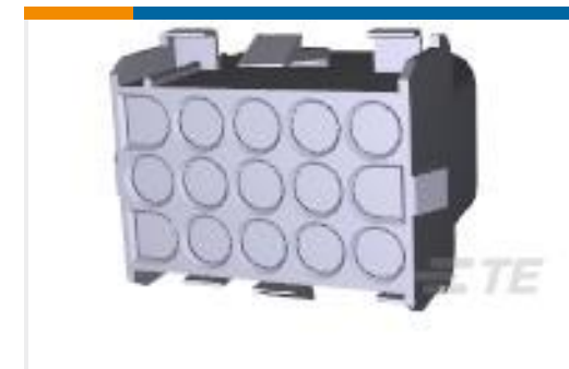
TE 产品编号1-480711-9 15P UMNL CAP HSG BLK