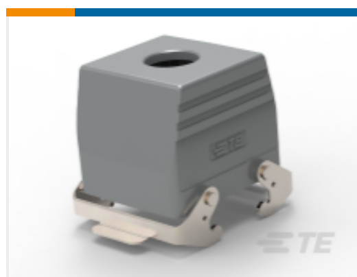
TE 产品编号 T1260322121-000 H32B-TGB-PG21