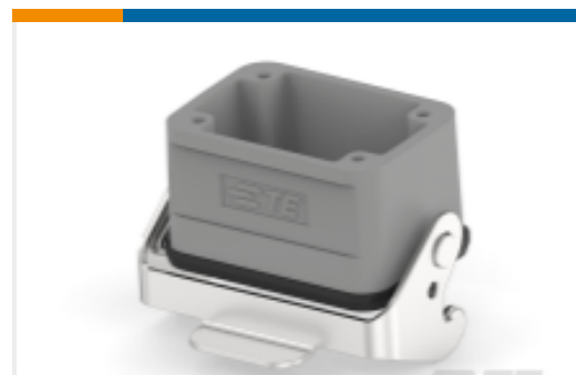
TE 产品编号T1730060000-000 H6B-TBF-T