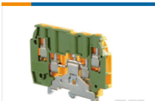
TE 产品编号1SNA195638R2300 M4/6.4A.P