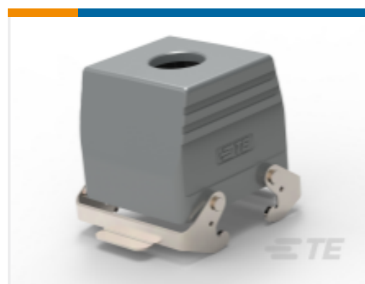
TE 产品编号 T1260322129-000 H32B-TGB-PG29