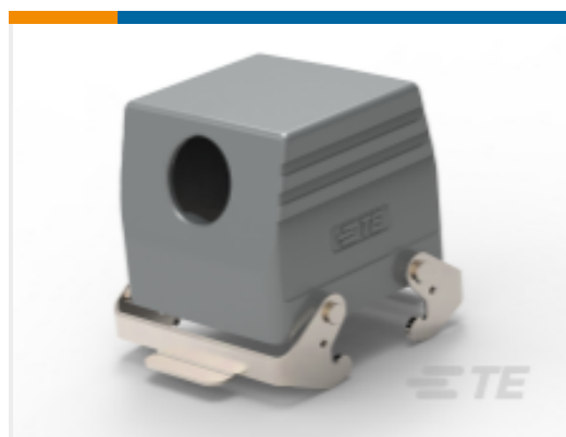
TE 产品编号 T1250322129-000 H32B-TSB-PG29