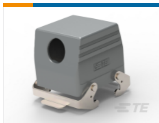
TE 产品编号 T1250322132-000 H32B-TSB-M32