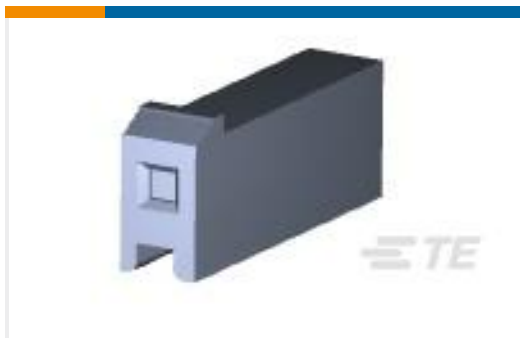
TE 产品编号640250-1 01P SL156 HSG W/LCK RAMP NATL