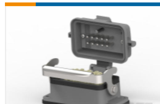
TE 产品编号T2120100219-000 ZGG-10DSTK,1-7,2-8,3-9,4-6,5-10