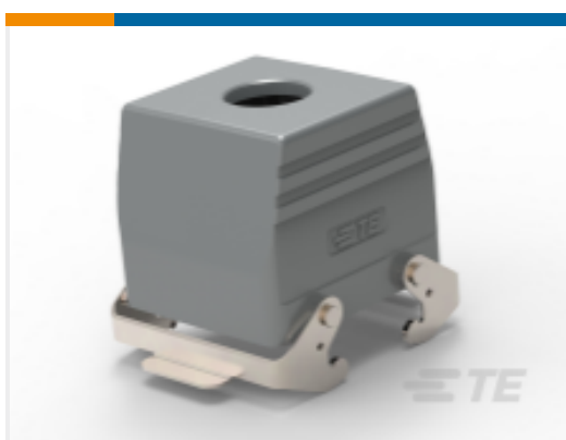
TE 产品编号 T1260320136-000 H32B-TGB-PG36