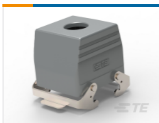
TE 产品编号 T1260320140-000 H32B-TGB-M40