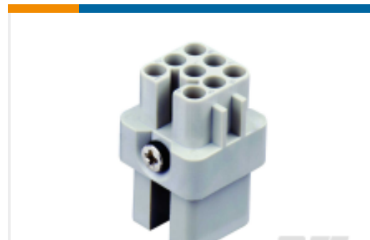
TE 产品编号T2020082201-000 HD-008-F