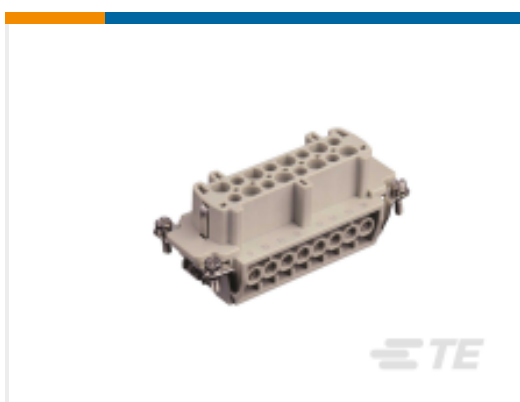
TE 产品编号 T2040322201-000 HE-016-F 17-32