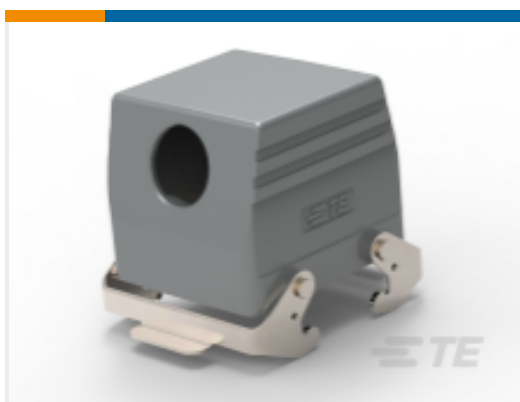
TE 产品编号 T1250322121-000 H32B-TSB-PG21