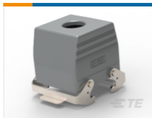
TE 产品编号 T1260320132-000 H32B-TGB-M32