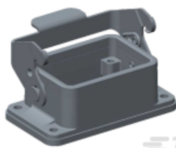
TE 产品编号 T1500063000-000 H6B-AG