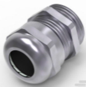
TE 产品编号 T3609320102-000 DLX-32-M