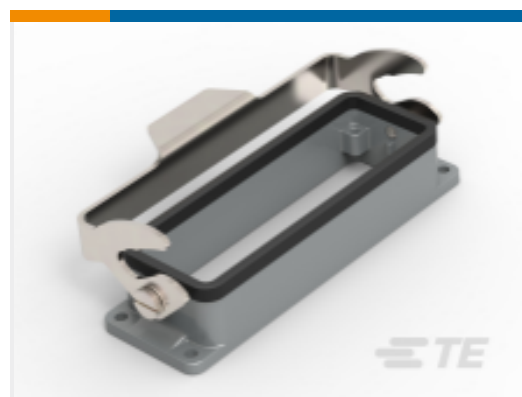
TE 产品编号 T1500243000-000 H24B-AG-LB