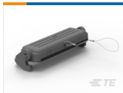
TE 产品编号 T1010241500-000 H24B-KDTP-LB