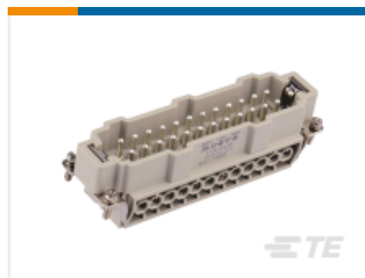
TE 产品编号 T2040242101-000 HE-024-M