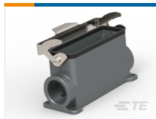
TE 产品编号 T1650243121-000 H24B-SGRH-LB-PG21