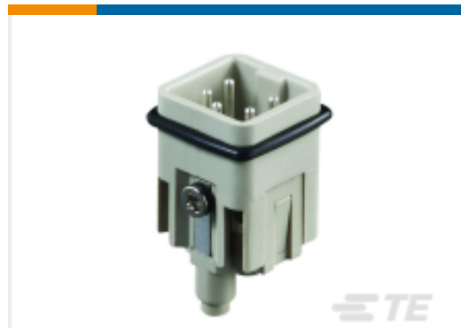
TE 产品编号T2010042101-000 HA-004-M