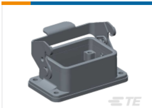
TE 产品编号T1500063000-000 H6B-AG