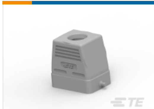
TE 产品编号T1320060125-000 H6B-TG-M25