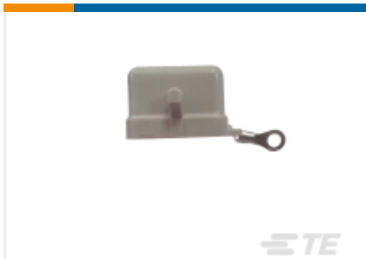
TE 产品编号T1010032100-000 H3A-KDBP-NY150