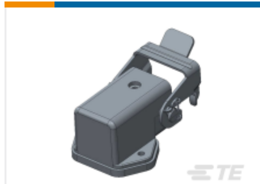
TE 产品编号T1549030000-000 H3A-MAGS