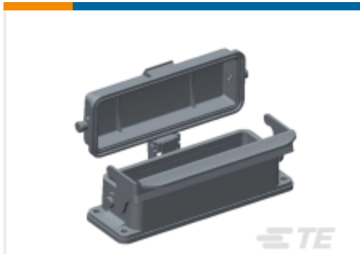
TE 产品编号T1510243000-000 H24B-AD-LB