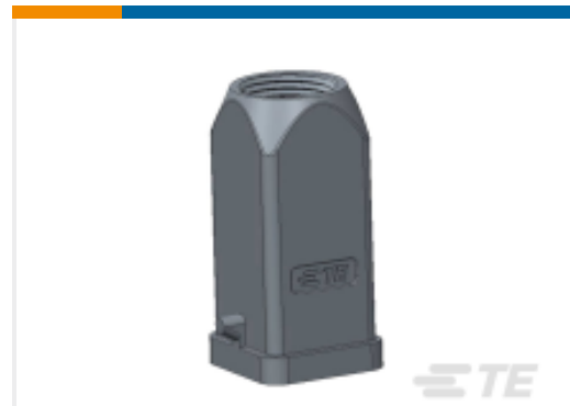
TE 产品编号T1329030111-000 H3A-MTG-PG11