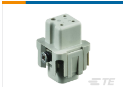
TE 产品编号T2010032201-000 HA-003-F