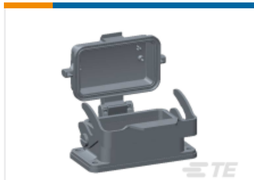
TE 产品编号T1510103000-000 H10B-AD-LB