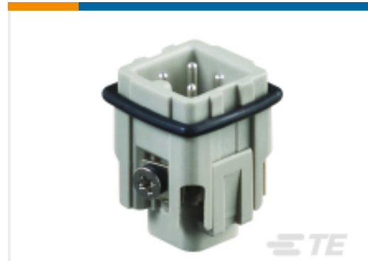
TE 产品编号T2010032101-000 HA-003-M