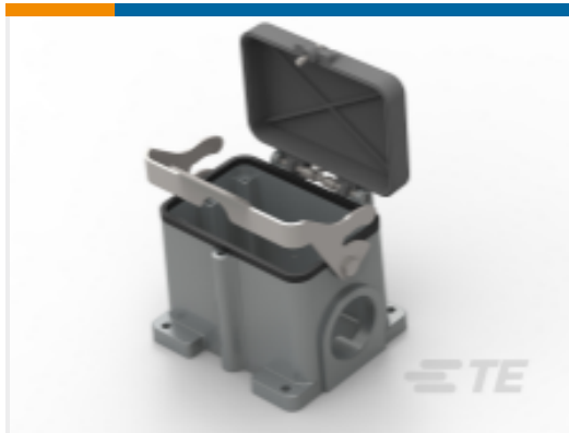
TE 产品编号T1620480129-000 H48B-SDR-LB-PG29