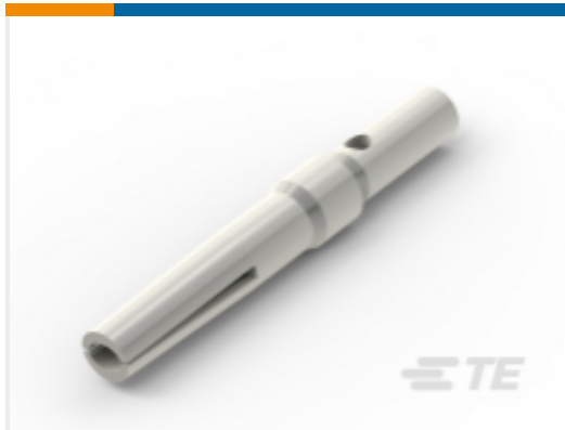
TE 产品编号T2070002033-000 CAF-33