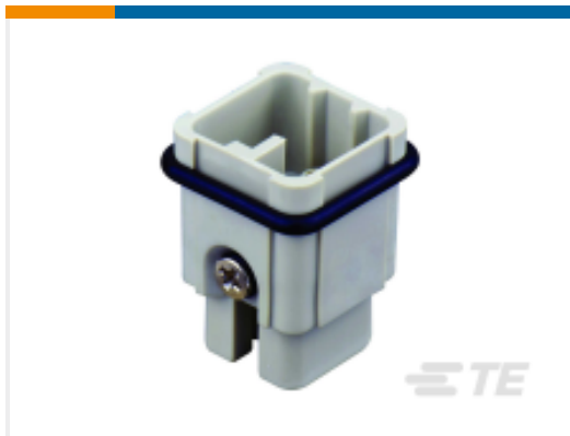
TE 产品编号T2020072101-000 HD-007-M