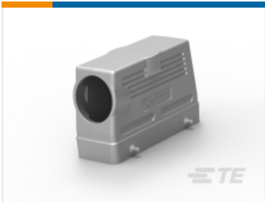
TE 产品编号T1230240140-000 H24B-TSH-M40