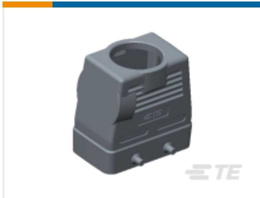
TE 产品编号T1240100129-000 H10B-TGH-PG29