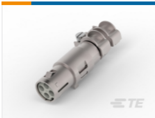
TE 产品编号T2580032154-000 PIN-Q2-F