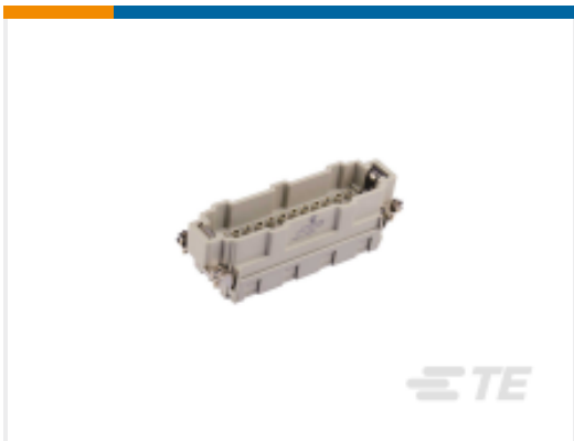
TE 产品编号T2040484101-000 HE-024-MC 25-48