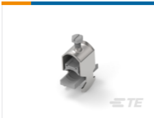
TE 产品编号T1918121800-000 BK18,14-18