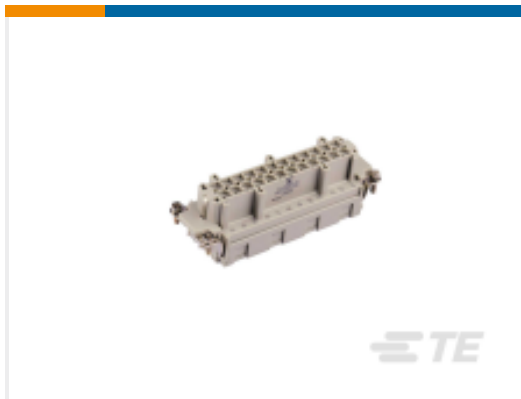
TE 产品编号T2040484201-000 HE-024-FC 25-48