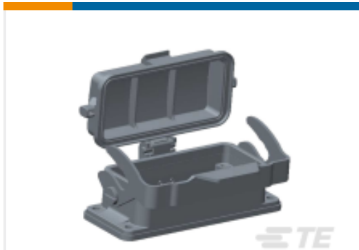
TE 产品编号T1510163000-000 H16B-AD-LB