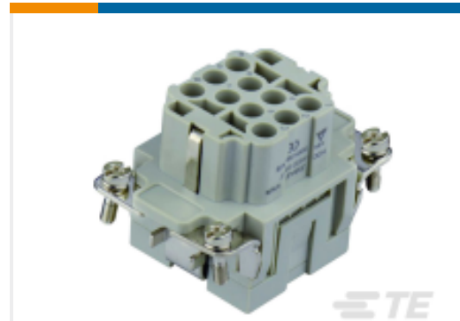
TE 产品编号T2050102201-000 HEE-010-F