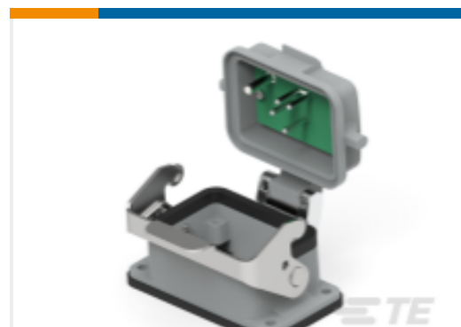
TE 产品编号T2120100116-000 ZGG-10DT(1-2,5-6)