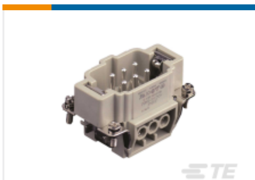
TE 产品编号T2040062101-000 HE-006-M