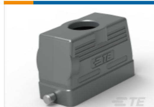
TE 产品编号T1320160121-000 H16B-TG-RO-PG21