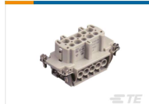
TE 产品编号T2040102201-000 HE-010-F