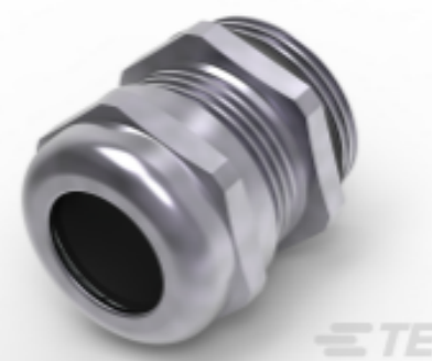
TE 产品编号 T3707250113-000 DLX-25-MTC (11~16)