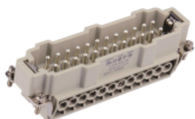
TE 产品编号 T2040242101-000 HE-024-M